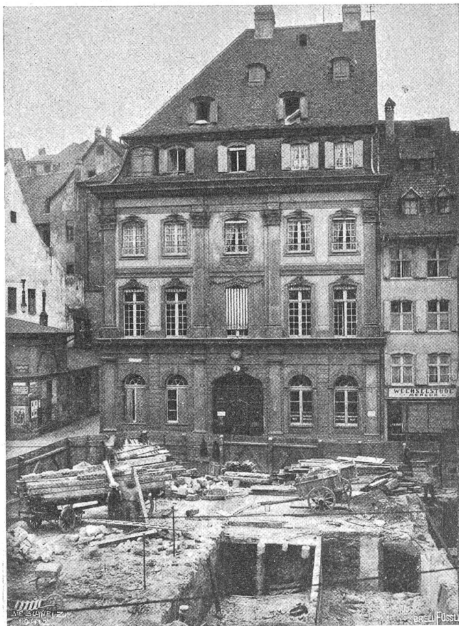
Das einstige Postgebäude von Basel.