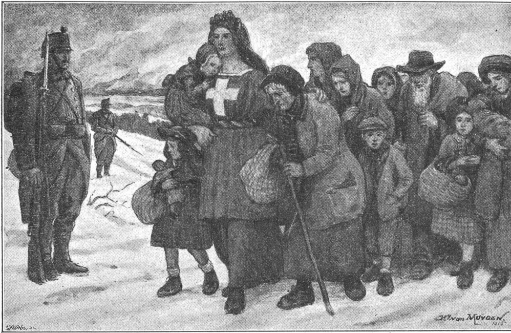
Bundesfeierkarte 1915 , entworfen von Henry van Muden, Genf (Ausführung durch die Firma Sabag, Etablissements Fréd. Boissonnas et Société Anonyme des Arts graphiques, Genève).