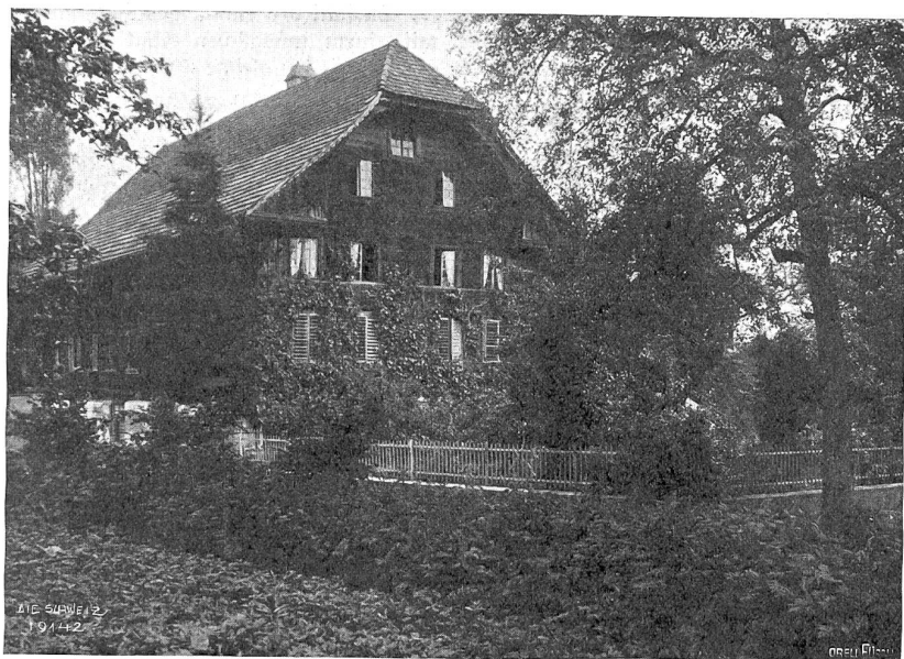
Blifshofen Abb. 10. Bauernhaus (18. Jahrh.).