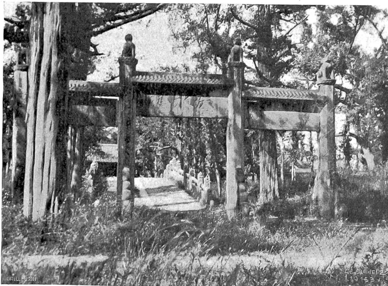
Chüfu Abb. 7. Ehrenbogen und weiße Marmorbücke, die zur Grabstätte des Confucius führt.

an seinem Gott noch seiner Ueberzeugung irregeleitet werden, da ihm dieses Pflichtgefühl das spät erscheinende Lebensglück abgräbt. Denn unantastbar und unverrückbar steht in diesem Manne seine innere Welt, die er auf den Grundfesten der Pflichttreue und des Gottvertrauens sich selbst erschaffen und in sich verschlossen hat und aus der er seine beste Kraft und seine Freiheit schöpft; daß der Dichter uns erkennen läßt, wie es diese selbe innere Welt ist, in der Schuld und Tragik im Leben des Mannes wurzeln und wie er es uns zeigt, nämlich nicht durch hinweisende Worte, sondern durch das bloße Ereignis, das ist ein Meisterstück psychologischer Kunst, wie man es nur ganz selten einmal antrifft. Die stille, gehaltene Geschichte des Liberius, in der alles Heiße und Laute wie durch die Art des Helden so auch durch die Sprache des Dichters, die sich hier in ganzer durchsichtiger, manierloser Meisterschaft zeigt, gedämpft wird, steht in dem eben erschienenen Buche „Uralters Lied!“*) zusammen mit vier andern Erzählungen, deren Schwer-