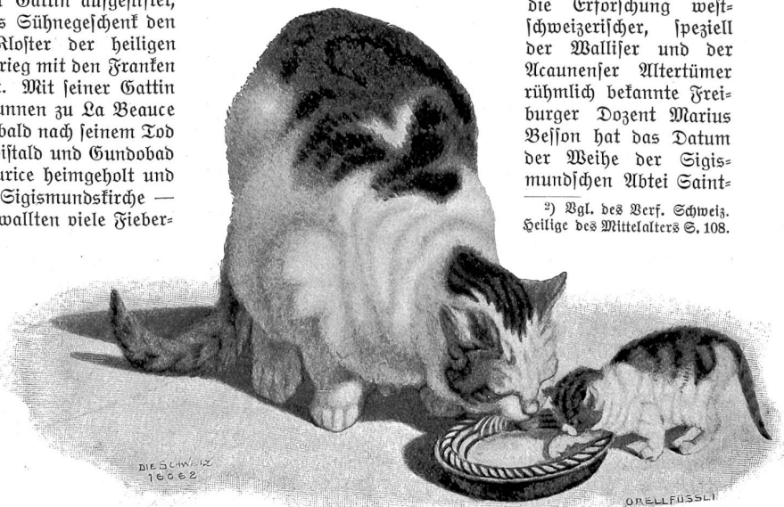
Gottfried Mind (1768—1814).

2) Vgl. des Verf. Schweiz. Heilige des Mittelalters S. 108.