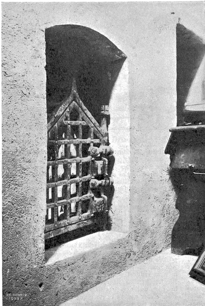
Sigismundsgrab zu Saint-Maurice im Wallis.

Maurice genau festgestellt: sie geschah am Dienstag, 22. September 515 3) .