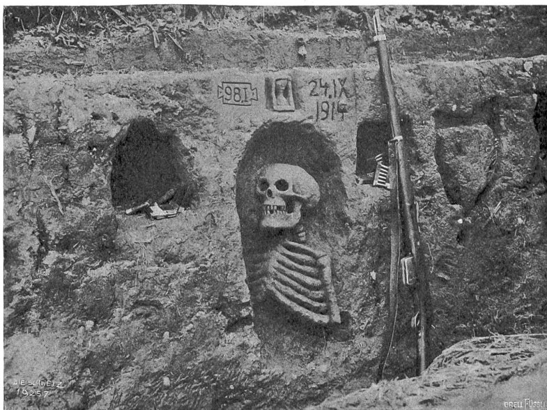
Das Geripp im Schützengraben.

An allen Ecken und Enden verliebte Pärchen, hier schmachtende Sehnsucht, dort schelmische Neckerei. Aber zunächst sind immer die Unrichtigen beisammen, bis schließlich jedes Seelchen — ein Lieblingsausdruck Hardungs — sein passendes Seelchen findet: ein lustiger Krieg des Herzens mit dem rechnenden Verstande, wobei das Herz Sieger bleibt, nachdem die Weibchen die Männer „langsam rösten ließen, bis sie warm und weich und gar“ geworden. Man würde über das reizende Spiel, das wohl hinsichtlich der Erfindung kaum auf besondere Originalität Anspruch machen wird, noch reinere Freude empfinden, wenn nicht stellenweise eine gekünstelte Sprache, die selbst dem, der sich mit Hardungs Ausdrucksweise einigermaßen vertraut ge- macht hat, nicht immer sofort verständlich ist, den Genuß be- einträchtigen würde. Worte, nur Worte glaubt man oft zu hören, und erst nach und nach will sich ein Gebild gestalten. Das aber hemmt den leichten Fluß der aufs Zarte und Leicht- beschwungte gestimmten Dichtung, und das leidige Shake-