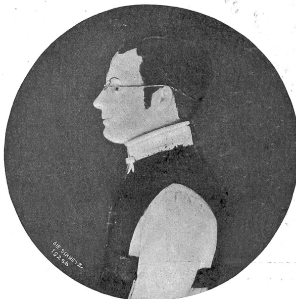
P. Alberik Zwysfig (1808—1854), der Komponist des „Schweizerpsalm“.