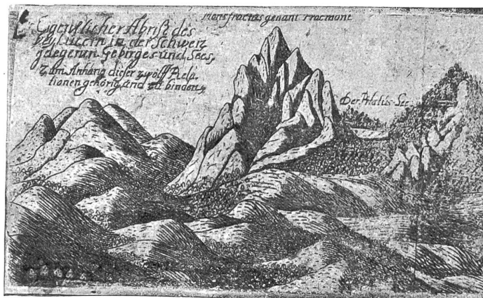
Der Pilatus und seine Geschichte. Abbildung von Pilatus und Pilatussee aus dem Jahre 1877.

fieren von Imfeld im weitem mehrere Panoramen von Pilatusgipfeln.