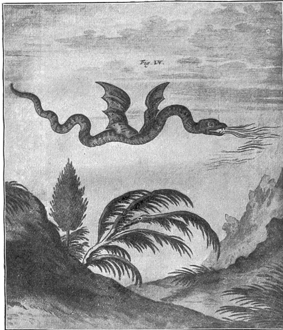
Der Pilatus und seine Geschichte. Der angebliche Pilatusdrache (nach Johann Jacob Scheuchzer).

Zwei Bauern, ein echter Landsknechtstyp und ein etwas schwermütiger Bayer, reisen nach Offenburg mit dem ersten Schnellzug zwischen München und Frankfurt, der nach der Mobilmachung wieder verkehrt. Es sind zwei wackere Landstürmler. „Wir haben bis Mittag auf dem Feld gearbeitet, dann sind wir zwei Stunden zu Fuß nach der Bahn gegangen, um dem Ruf des Vaterlandes zu folgen.“ Sie sitzen ruhig und vertrauensvoll mit den ärmlichen Kofferchen zwischen den Beinen und reden erfreut von ihrer Tätigkeit. „Tag und Nacht gab's zu arbeiten zu Haus; jetzt sind die Felder besorgt, die Ernte gut eingebracht, Frau und Kinder machen die neue Aussaat. Alles wurde bedacht. Deutschland soll in diesem und im nächsten Jahr keinen Hunger leiden. Jetzt stehen wir zur Verfügung der Obrigkeit, und wir haben geschworen für Gott und König. Für Gott und König werden wir leben und sterben.“ Das Landsknechtsvorbild ist Junggeselle. Er deutet auf seine Reisetasche: „Die ist schon mit zur Rekrutenschule gewandert, nun war sie lange Zeit unbenutzt; jetzt hab ich sie wieder hergenommen, sie soll mich auf meinem letzten Gang zu den Fahnen begleiten.“