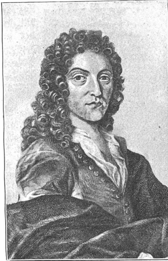
Johann Jacob Scheuchzer (1672–1733), der berühmte Arzt, Naturforscher und Alpenkundige.

Der Schaffner pfeift; der Zug setzt sich in Bewegung; die vaterländischen Lieder schallen mächtig in der Bahnhofshalle, alle Schmerzen übertönend. Die Frauen bleiben zurück, Hoffnung oder Sorge und Leid im Herzen, mit wehendem Taschentuch und feuchten Augen.