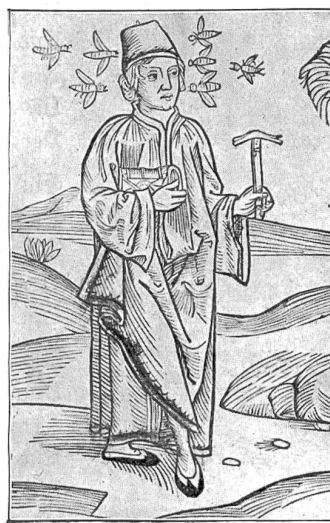
Felix Hemmerlin (1389–ca. 1460), ein früherer Gewährsmann für die Geschichte des Pilatus.

Nur noch Xaver Imfeld sei erwähnt, der schon als Industrieschüler in Luzern im Jahre 1870 ein Pilatusrelief im Maßstabe 1:50,000 hergestellt hatte und in Zürich als letzte und vollendetste Arbeit im Jahre 1909 das Relief im Maßstabe 1:25,000 hinterließ. Eines im Maßstabe 1:10,000 blieb unvollendet. Dagegen exi-