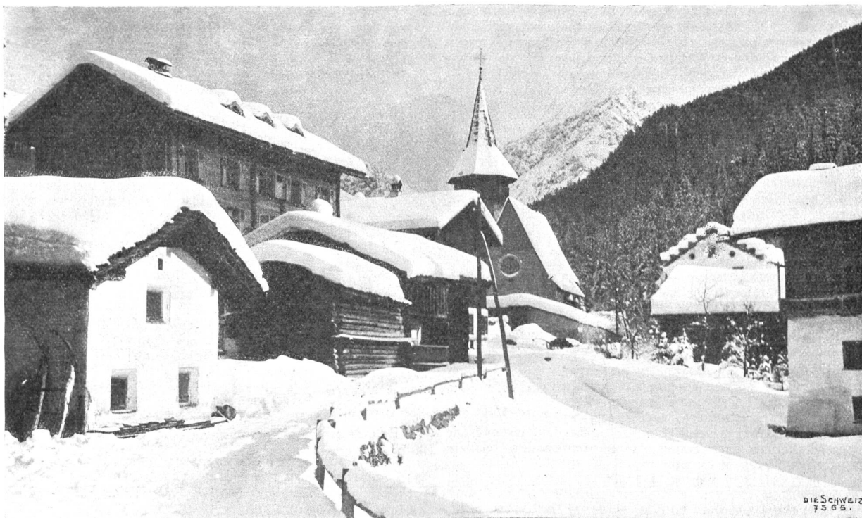
Winterstimmung bei Arosa.