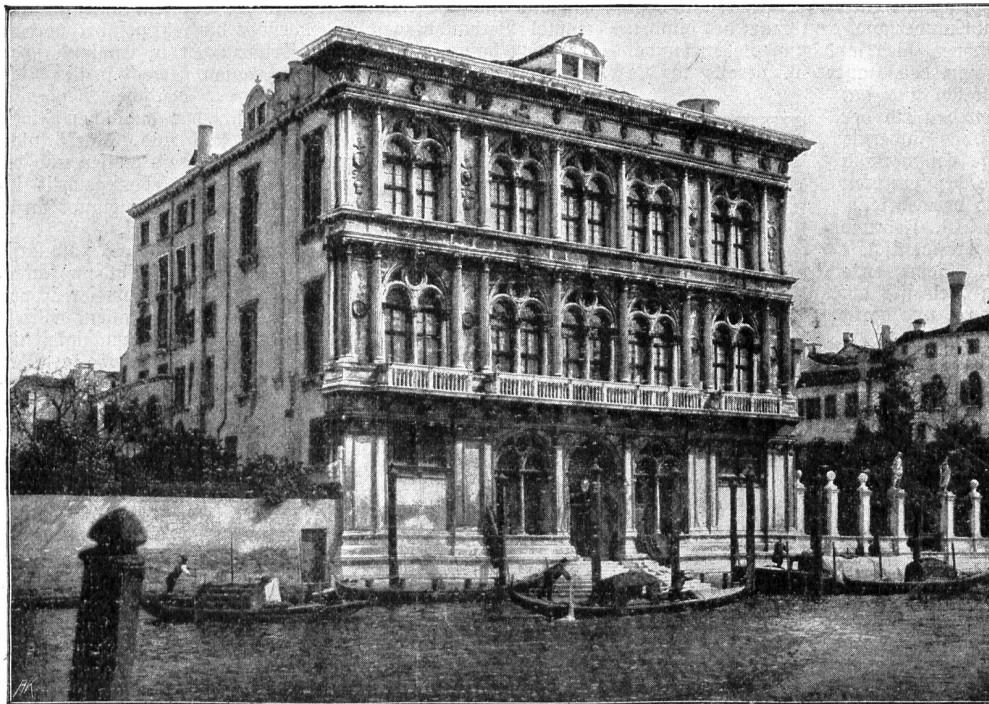
Wagners Sterbehaus in Venedig, der Palazzo Vendramin.