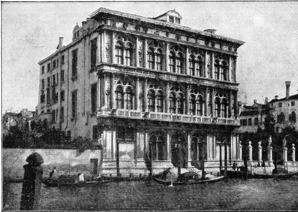
Wagners Sterbehaus in Venedig, der Palazzo Vendramin.