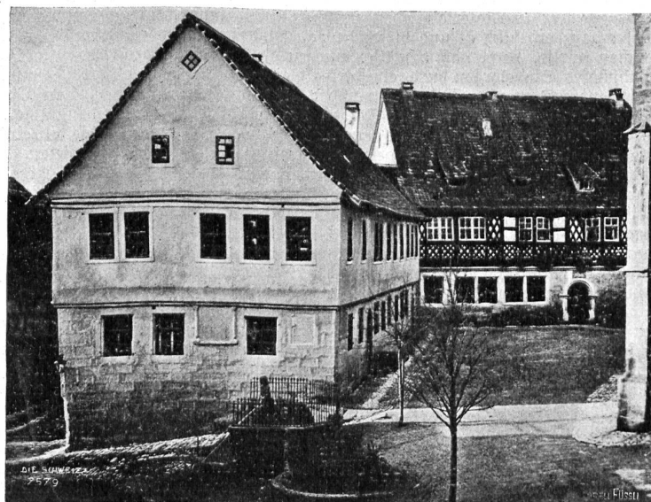
Geburtshaus von Otto Ludwig in Eisleben.

Der erste Direktor der Schweizerischen Kranken- und Unfallversicherungsanstalt. Am 14. Januar hat der Bundesrat die Direktion der Schweizerischen Versicherungsanstalt be-