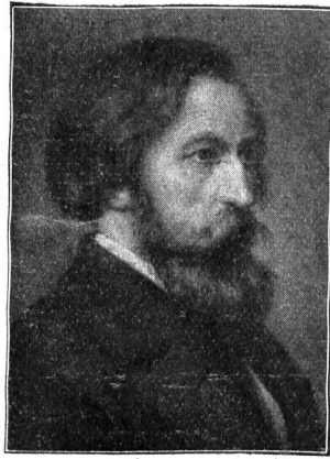
zum 100. Geburtstag des Dichters Otto Ludwig.