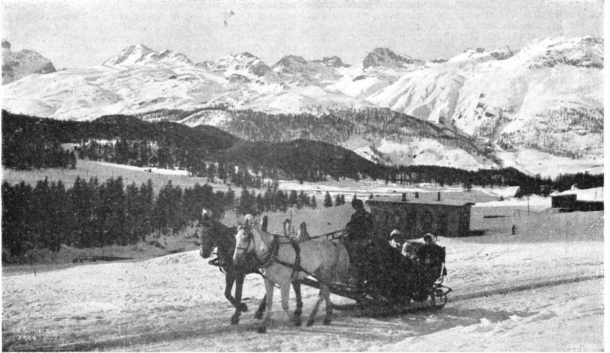
Schlittenfahrt nach Pontresina.

Redaktion der „Illustrierten Rundschau“: Willi Bierbaum, Zürich V, Dufourstrasse 91. Telefon 6313. — Korrespondenzen und Illustrationen für diesen Teil der „Schweiz“ beliebe man an die Privatadresse des Redaktors zu richten.