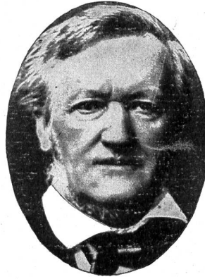
Zum 50. Todestag Richard Wagners.

Das Drama am Südpol, wo Hauptmann Scott mit seinen vier Begleitern zu „guterleht“ auch noch den schauerlichsten Tod gefunden, nachdem ihm Amundsen schon den Entdeckerruhm vorweggenommen, hat in der ganzen Welt Teilnahme erweckt. Aber das Schicksal Scotts wird den Ehrgeiz der Menschen nicht vor neuen Wagnissen abschrecken, bis auch die letzten Rätsel des immer noch von geheimnisvollen Zweifeln umnebelten Nordpols enthüllt sind.