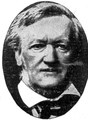
Zum 50. Todestag Richard Wagners.

Das Drama am Südpol, wo Hauptmann Scott mit seinen vier Begleitern zu „guterleht“ auch noch den schauerlichsten Tod gefunden, nachdem ihm Amundsen schon den Entdeckerruhm vorweggenommen, hat in der ganzen Welt Teilnahme erweckt. Aber das Schicksal Scotts wird den Ehrgeiz der Menschen nicht vor neuen Wagnissen abschrecken, bis auch die letzten Rätsel des immer noch von geheimnisvollen Zweifeln umnebelten Nordpols enthüllt sind.