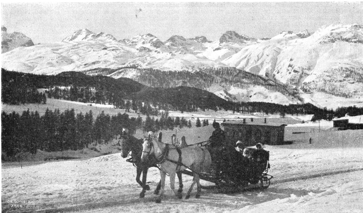
Schlittenfahrt nach Pontresina.

Redaktion der „Illustrierten Rundschau“: Willi Bierbaum, Zürich V, Dufourstrasse 91. Telefon 6313. — Korrespondenzen und Illustrationen für diesen Teil der „Schweiz“ beliebe man an die Privatadresse des Redaktors zu richten.