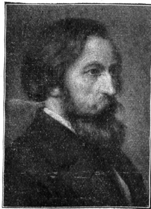
Zum 100. Geburtstag des Dichters Otto Ludwig.