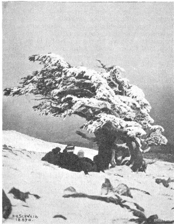
Im Schneegestöber über den Atlas Abb. 3. Raft unter der tausendjährigen Zeder.

Um vier Uhr war Tagwache, und bis halb sechs Uhr dauerte das Frühstück. Am Abend zuvor wunderbarer Stern-