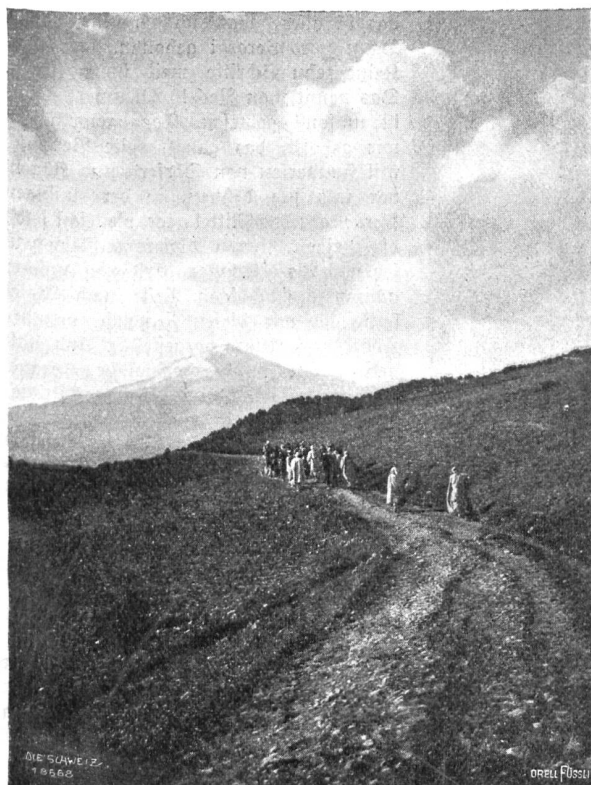
Im Schneegestöber über den Atlas Abb. 2. Auf dem Marsch nach Tala Kana; im Hintergrund die Sella Kredidja (2308 m).

Spalte sehe ich in eine Hütte: ein dunkles Loch zum Schlafen, sonst nichts. Unsere Kabhlen aber rollen die Augen; ich ziehe mich zurück. Die Mohamedaner sind in gewissen Dingen sehr empfindlich! Man sagt, es fließe noch römisches Blut in den Stämmen dieses Landes, und einige von uns wollen denn auch unter den Männern römische Typen herausfinden. Auch die Landschaft erinnert mächtig an Italien, wie wir allmählich auf die Höhe gelangen und hinunterblicken in das weite Flußtal, das hügelige Land mit den weichen rundlichen Formen der Pinien und Delbäume, den weißen Gehöften, die allmählich in bläuliche Schleier tauchen. Ich gedente eines wundervollen Abends in Fiesole: in der Tiefe das breite fruchtbare Arnotal und ringsum die grünen toskanischen Hügel mit Landhäusern und Dörfern. Es fehlen nur die schwarzen schlanken Zypressen. Die Nacht bricht herein. Unsere Begleiter haben uns schon eine geraume Zeit verlassen. Wir langen auf einer Höhe von etwa 1000 Metern vor einer kleinen Hütte an, die von hohen Mauern umgeben ist, einer wirklichen Festung. Das ist das Försterhaus von Tala Kana.