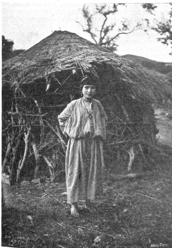
Im Schneegestöber über den Atlas Abb. 6. Eine kabylische Schönheit.