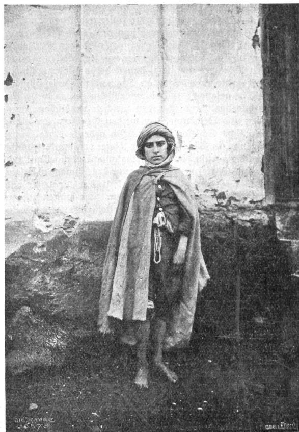
Im Schneegeföber über den Atlas Abb. 5. Der Musterführer von Ain-Zada.

Wetter wäre eine Kletterei eine willkommene Abwechslung im Reiseprogramm gewesen, selbst für diejenigen ohne Stod und genagelte Schuhe; denn der Fels ist gut. Jedoch diesen Verhältnissen ist unsere Ausrüstung nicht gewachsen. Unverdroffen rutschen wir trotzdem talwärts, sorgfältig die steilen Bänder vermeidend. Aber die Füße gehorchen nicht; die