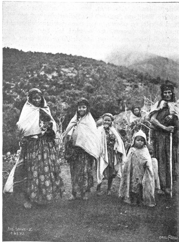
Im Schneegestöber über den Atlas Abb. 7. Kabylische Frauen und Kinder.

Heute galt es, in einem der Dörfer Quartier zu erhalten. Das war mit Schwierigkeiten verbunden; denn ein Mohamedaner durfte uns der Landessitte gemäß nicht aufnehmen,