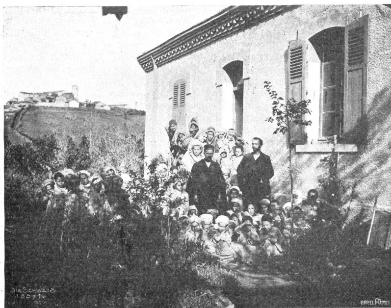
Im Schneegeföber über den Atlas Abb. 4. Eine Schule in Ain-Zada.