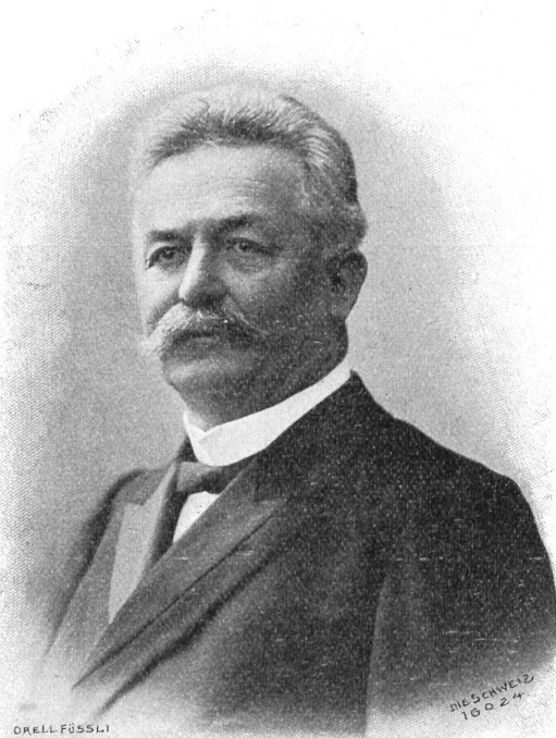
Oberst Eduard Müller, Bundespräsident für 1915.

Die Erneuerung des Dreibundes, die am 5. Dezember in Wien erfolgte, zählt zu den wichtigsten Ereignissen der vergangenen Tage. Mit ihr hat die Gestaltung Mitteleuropas wiederum auf zwölf Jahre ihr solides Fundament erhalten. So ungleichartig Wesen und Interessen der drei Kontrahenten auch sein mögen, sie haben doch alle ihren Vorteil dabei gefunden, fest zusammenzuhalten. Das wird auch in Italien in immer weitem Kreise erkannt, und von der Regierung wird es offen ausgesprochen, daß es Italien nicht möglich gewesen wäre, den raschen wirtschaftlichen Aufschwung und die Angliederung der libyschen Kolonie zu erringen, wenn es nicht am Dreibund seinen starken Rückhalt gehabt hätte. Was aber Österreich der deutschen Bundesstreue auf dem Balkan zu verdanken hat, das ist mit Gold nicht aufzuwiegen. Das deutsche Heer war der schwerste Gewichtsstein, den Österreich in die Waagschale seiner Inter-