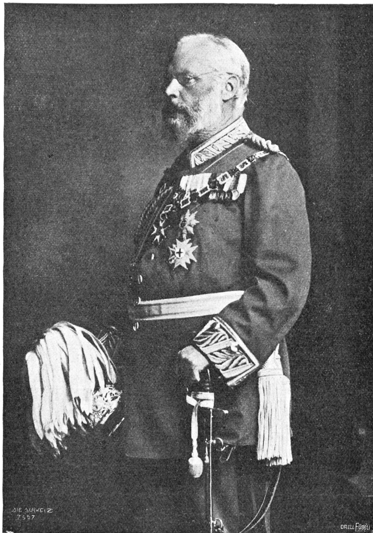
Prinzregent Ludwig von Bayern.

nis mit den übrigen Verbündeten, denen es besser diente, wenn die griechische Flotte die Aufsicht über die Seefahrten von Anatolien her behielt und die Feindseligkeiten fortsetzte, um die Türkei auch während des Waffenstillstandes zu beschäftigen und die Vorbereitung zu einer erfolgreichen Fortsetzung des Krieges zu verunmöglichen. Gleichwohl gingen aber auch griechische Unterhändler nach London, wo sich freilich die Türken sträubten, mit ihnen zu verhandeln, dann hiefür erst neue Instruktionen aus Konstantinopel einholten, was den Gang der Gespräche nicht wenig verlangsamte. Den Ehrenvorsitz in der Friedenskonferenz führt der englische Minister des Aeußern, Sir Eduard Gren; das Tagespräsidium hat abwechselnd eine der beteiligten Delegationen inne. Gleichzeitig mit den Friedensunterhandlungen tagten in London die Botschafter der sechs Großmächte. Aller noch drohenden Schwierigkeiten ungeachtet,