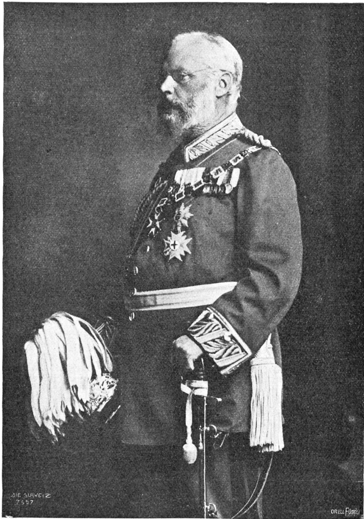
Prinzregent Ludwig von Bayern.

Die Friedensunterhandlungen. Am 3. Dezember ist in den Linien von Tschataldscha der Waffenstillstand unterzeichnet worden. Er sollte die Einleitung bilden zu den definitiven Friedensunterhandlungen, die am 16. Dezember in London begannen. Griechenland unterzeichnete das Waffenstillstandsprotokoll nicht, und zwar im Einverständnis mit den übrigen Verbündeten, denen es besser diente, wenn die griechische Flotte die Aufsicht über die Seezufahrten von Anatolien her behielt und die Feindseligkeiten fortsetzte, um die Türkei auch während des Waffenstillstandes zu beschäftigen und die Vorbereitung zu einer erfolgreichen Fortsetzung des Krieges zu verummöglichen. Gleichwohl gingen aber auch griechische Unterhändler nach London, wo sich freilich die Türken sträubten, mit ihnen zu verhandeln, dann hiefür erst neue Instruktionen aus Konstantinopel einholten, was den Gang der Geschäfte nicht wenig verlangsamte. Den Ehrenvorsitz in der Friedenskonferenz führt der englische Minister des Aeußern, Sir Eduard Gren; das Tagespräsidium hat abwechselnd eine der beteiligten Delegationen inne. Gleichzeitig mit den Friedensunterhändlern tagten in London die Botschafter der sechs Großmächte. Aller noch drohenden Schwierigkeiten ungeachtet,