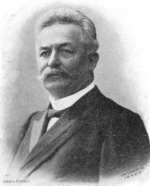
Oberst Eduard Müller, Bundespräsident für 1915.

Die Erneuerung des Dreibundes, die am 5. Dezember in Wien erfolgte, zählt zu den wichtigsten Ereignissen der vergangenen Tage. Mit ihr hat die Gestaltung Mitteleuropas wiederum auf zwölf Jahre ihr solides Fundament erhalten. So ungleichartig Wesen und Interessen der drei Kontrahenten auch sein mögen, sie haben doch alle ihren Vorteil dabei gefunden, fest zusammenzuhalten. Das wird auch in Italien in immer weitem Kreise erkannt, und von der Regierung wird es offen ausgesprochen, daß es Italien nicht möglich gewesen wäre, den raschen wirtschaftlichen Aufschwung und die Angliederung der libyschen Kolonie zu erringen, wenn es nicht am Dreibund seinen starken Rückhalt gehabt hätte. Was aber Oesterreich der deutschen Bundesstreue auf dem Balkan zu verdanken hat, das ist mit Gold nicht aufzuwiegen. Das deutsche Heer war der schwerste Gewichtstein, den Oesterreich in die Wagchale seiner Inter-