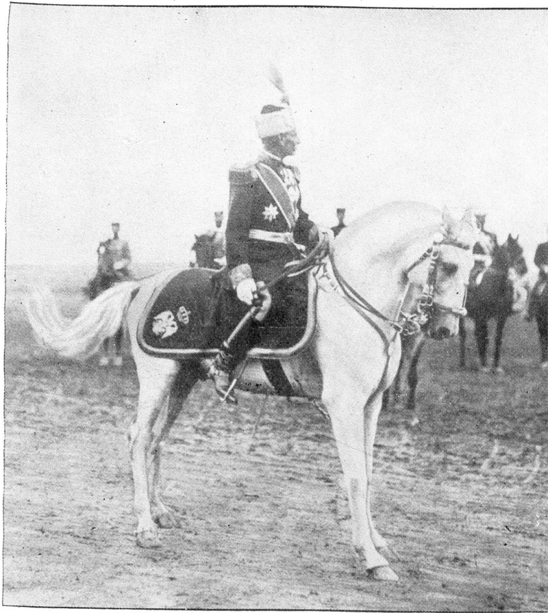
König Peter von Serbien.

Fall, dann wird ihnen Saloniki von den Griechen wohl abgetreten werden müssen. Am meisten hat auf der griechischen Seite bis jetzt die Flotte geleistet. Zu den schon erwähnten Eroberungen türkischer Inseln sind inzwischen noch Ikaría, westlich von Samos, die ganze Halbinsel Chalkidike, südlich von Saloniki, dann Mytileni und Chios gekommen, auf welcher letzterer Insel jedoch von den Türken noch hartnäckig gekämpft wird. Die Eifersucht Italiens und Oesterreichs erregte die Besetzung der Insel Saseno gegenüber von Valona an der Küste von Epirus, und es haben die Gesandten von Oesterreich und