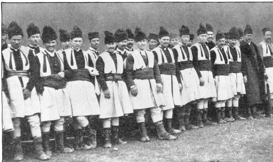
Serbische Bauern als Reservisten.

Albanien. Staatengebilde geben, wenn etwa aus den griechisch-serbisch-bulgarischen Rivalitäten noch ein „autonomes Makedonien“ hervorgehen sollte. Das wäre kein übler Witz der Weltgeschichte, bestrübend ist nur, daß ihn so viele Tausende mit ihrem Gut und Blut bezahlen mußten. Ueber die Motive und die Durchführung des Krieges der christlichen Balkanstaaten gegen