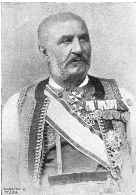
König Nikita von Montenegro.

Deutschland ist wieder von einem schweren Vergungslück heimgesucht worden. Die westfälische Grube „Minister Achenbach“ hat ein halbes Hundert Todesopfer gefordert. Und nach Neujahr droht wieder ein großer Bergarbeiterstreik im Saarrevier. Man bedauert die Bergleute, die für ihre unständiger Todesgefahr in tiefer Grube verrichtete Arbeit noch durch Streiks ihre kärgliche Entlohnung zu verbessern suchen müssen.