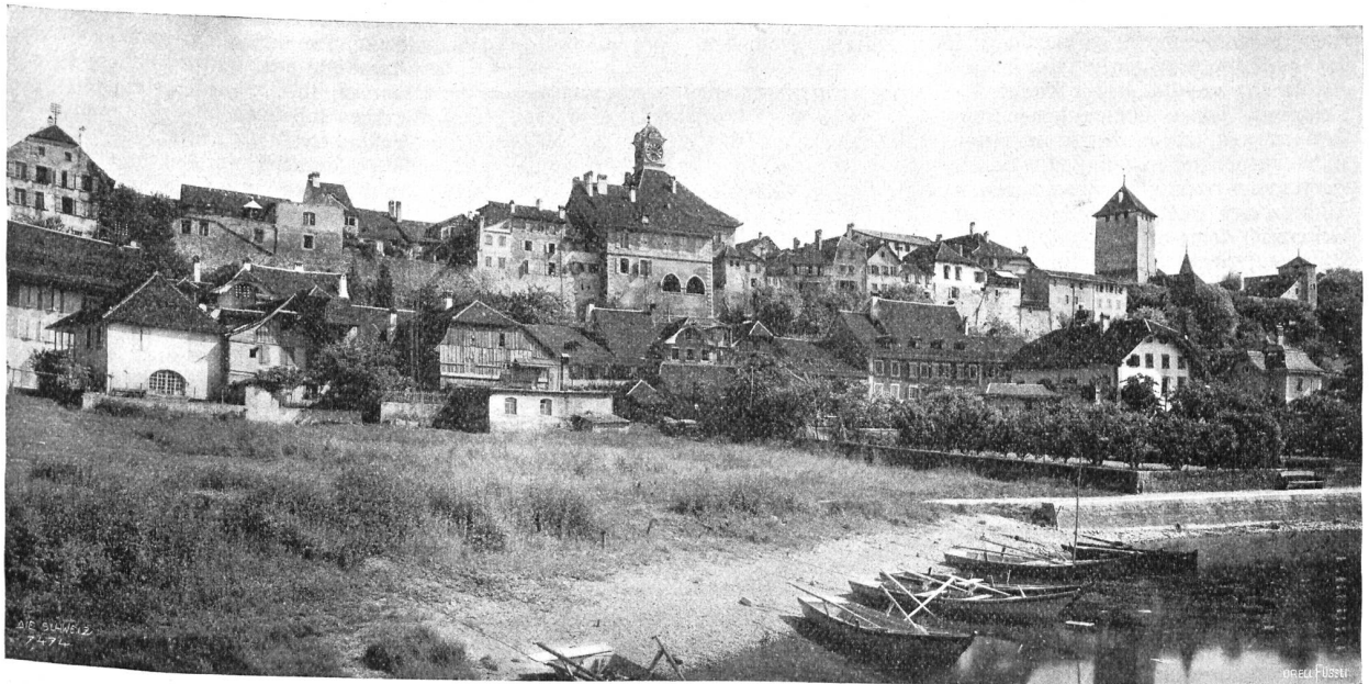
Mauern von der Seeseite aus. Phot. Anton Krenn. Zürich.