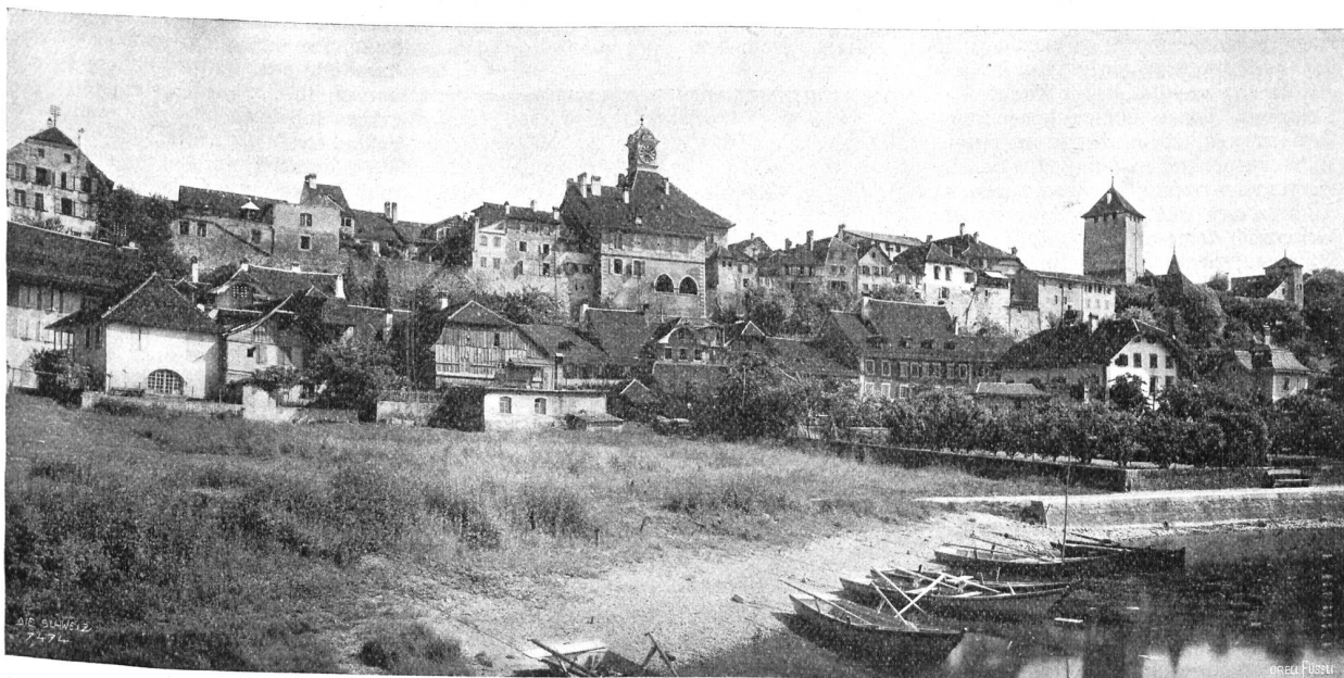
Murten von der Seeseite aus.