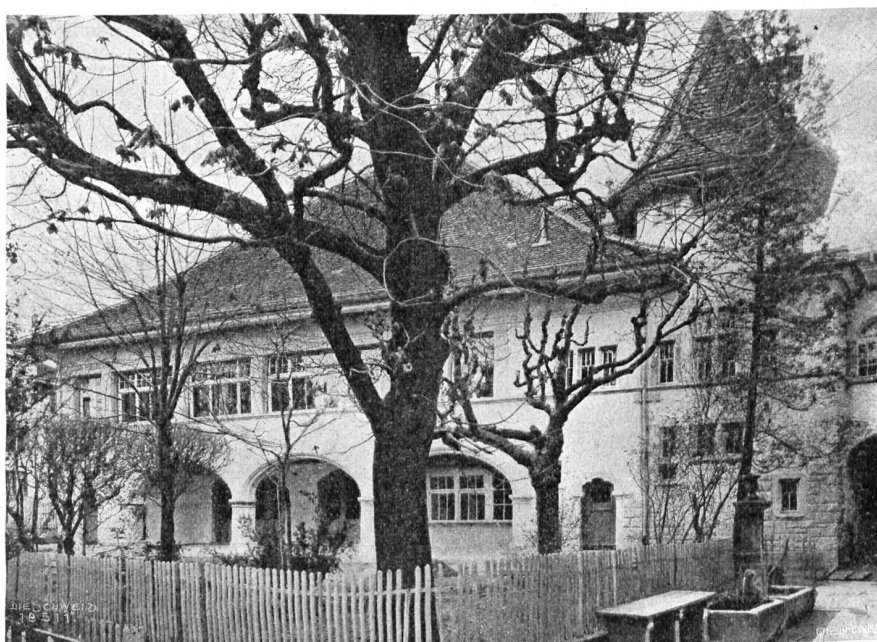
E. Wipf, Zürich.