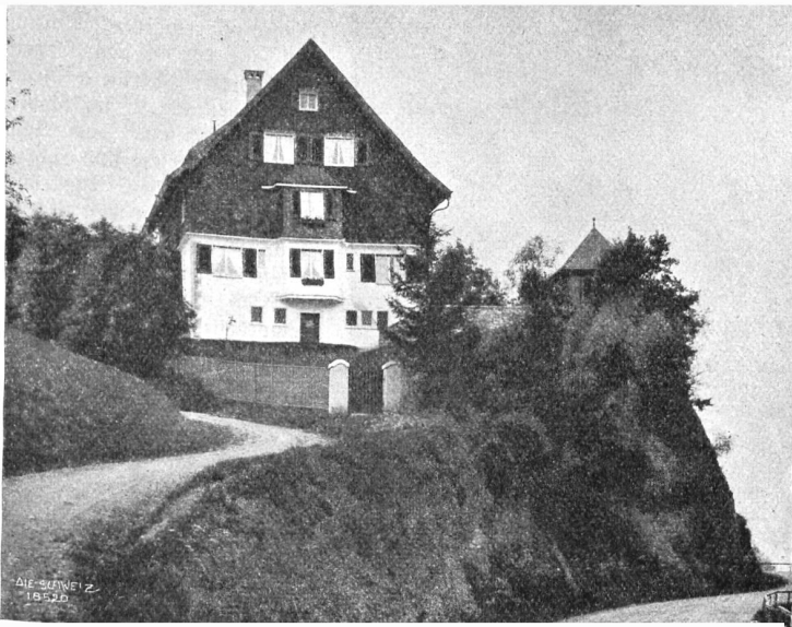
Rittmeyer &amp; Furrer, Winterthur.