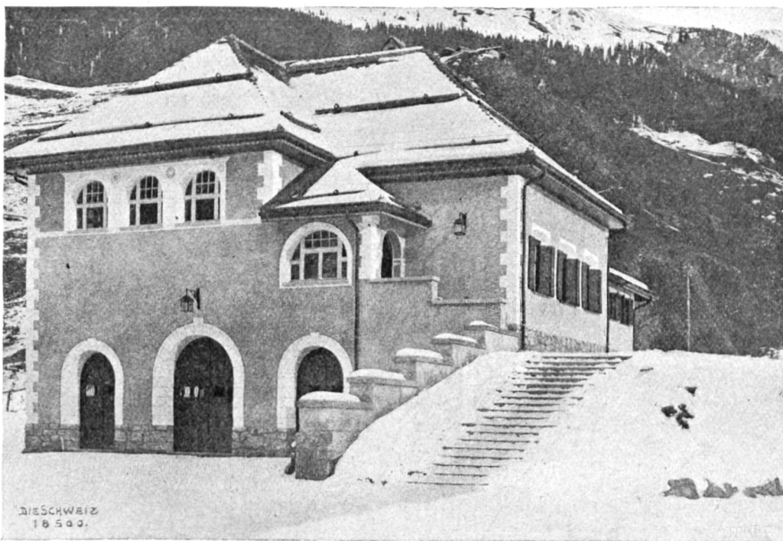
E. Wipf, Zürich.

Bis vor kurzer Zeit lebte man im Wahn, daß der Industriebau aus praktischen Gründen nicht ästhetisch einwandfrei gelöst werden könne. Die elektrische Zentrale der Jungfraubahn in Burglauenen (S. 9) von den Architekten Haller & Schindler in Zürich beweist uns das Gegenteil; ruhig und massig sitzt sie zwischen den Berggipfeln, ohne Beeinträchtigung des Landschaftsbildes.