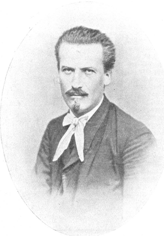
Heinrich Leuthold (1827–1879).

Wir wissen, daß Jakob Baechtold, unterstützt von