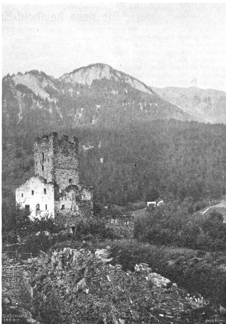
Burgruine Campi (770m) am l. Ufer der Albula (an der Schnfirake), Stammschloß der Familie Campi (Campo bello).

Wenn ich hier Carl Friedrich Wiegands schönes Buch