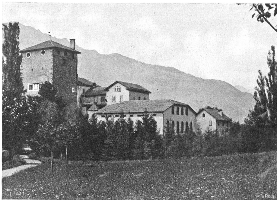
Rietberg ob Rodels (im innern Domleisch), von der Almenfer Seite.

Ein wilder Windstoß, der die Höhen herabgedonnert kam und die Pappeln am Weg halb zur Erde neigte, die Apfelbäume zauselte, daß die kahlen Äste knakten, und pfeifend durch die Fugen und Ritzen der Dächer tobte, weckte sie auf aus ihren Träumen. Sie wollte schlafen, ein letztes Mal schlafen. Aber sie fand keine Ruhe. Die Gedanken wälzten sich in ihrem Kopf. Ein Entschluß neigte zur Reife, und Pläne über das Wie ließen sie nicht los. Morgen, ganz früh, wollte sie zum Herrn Pfarrer eilen und ihm sagen, daß es nicht sein soll. Sie wollte ihm gestehen, alles, alles wollte sie sich von der Seele herunterbeichten. Möchten sie sagen, was sie wollten, die andern. Möchte geschehen, was geschehen mochte. Nur nicht diese Lüge, diese große, schändliche Lüge! Ob sie den Mut habe, zu tun, was sie tun wollte? Und Mutter? Was hatte sie gelobt? Was hatte sie geschworen? Mutter!?