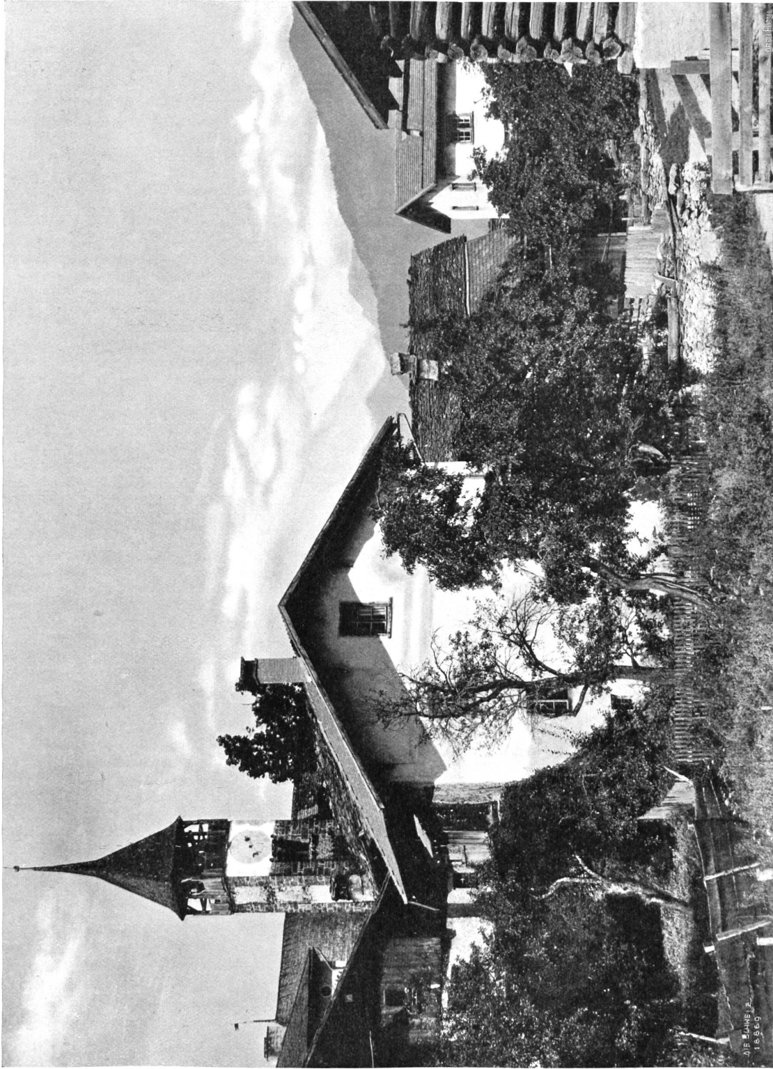
Scharans im Domleithg.