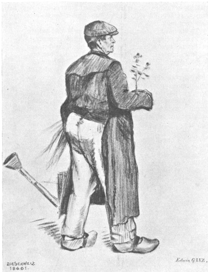
Edwin Ganz, Zürich-Brüssel.