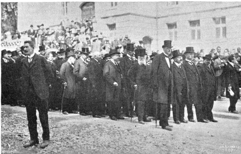
Die Gruppe der Reichstagsabgeordneten im Leichenzug Bebels in Zürich.