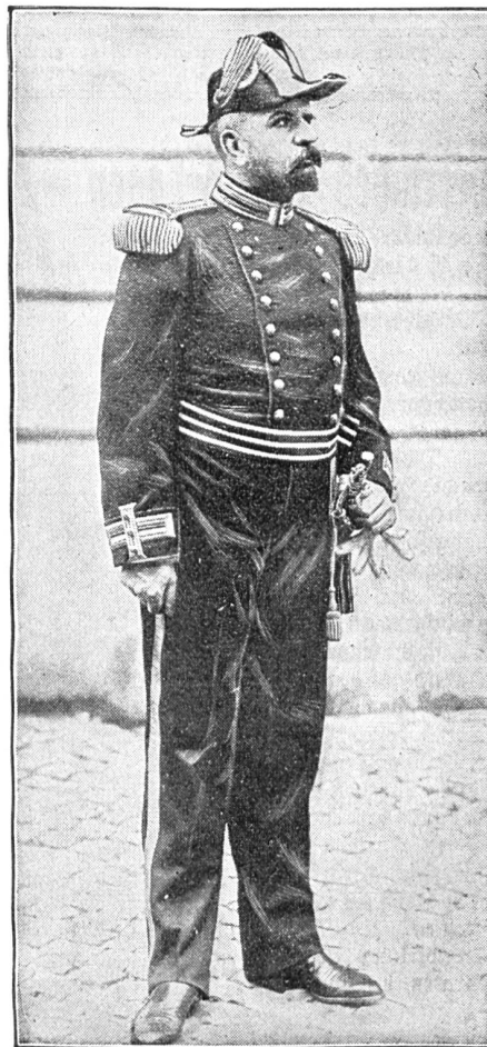
Oberst Repoud, Kommandant der päpstlichen Schweizergarde.

mit ärztlicher Hilfe (es kommt im Durchschnitt erst auf 22,000 Einwohner ein akademisch gebildeter Arzt) und das Ueberhandnehmen der nach den Dörfern aus dem Süden verschleppten Seuchen erscheint neben den Verheerungen des Alkohols als minder wichtig. Im Landgouvernement Pensa z. B. sind von 10,000 Einwohnern 312 syphilitisch, in Moskau 120 schwindsüchtig. Der staatlich vertriebene Alkohol, der zum Monopol gemacht wurde, um dem Schnapsgenuß zu steuern, ist der schlimmste Würgengel der russischen Jugend. Es ist da ganz