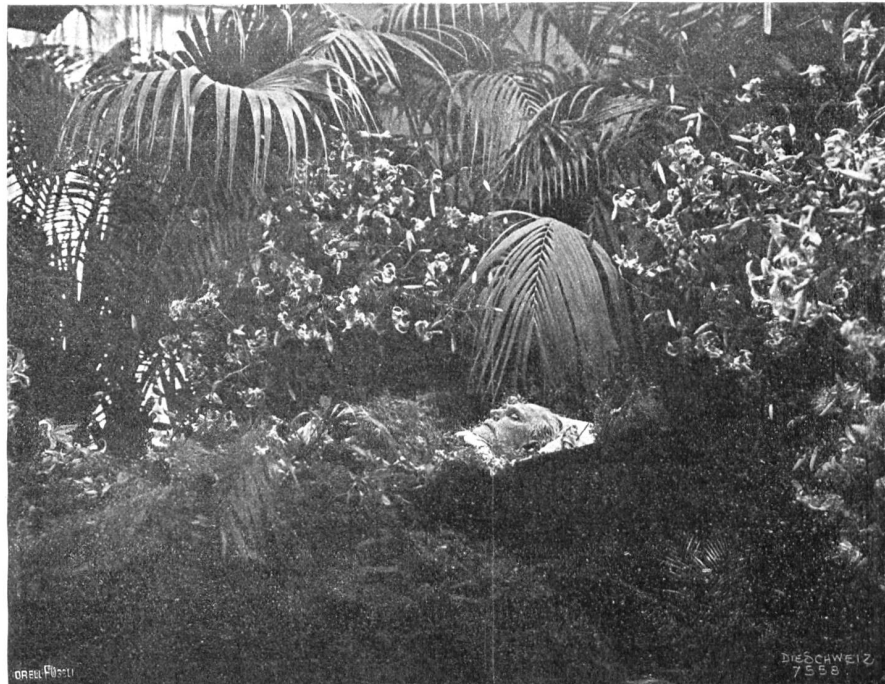
Die aufgebahrte Leiche August Bebels in Zürich.

Seine Angriffe gegen das Deutsche Reich und sein Eintreten für die Internationale hatten 1872 eine Anklage wegen Vorbereitung zum Hochverrat zur Folge. 1872 wurde er zusammen mit Liebknecht zu zwei Jahren Festungshaft und außerdem wenige Monate später wegen Majestätsbeleidigung zu neun Monaten Gefängnis verurteilt. Gleichzeitig wurde ihm das Reichstagsmandat aberkannt; doch wählte ihn bei der im Januar 1873 erfolgten Neuwahl sein alter Wahlkreis Glauchau-Meerane wieder. Von 1877 bis 1881 vertrat er Dresden. Im Jahre 1877 wurde Bebel, der sich in Dresden hatte naturalisieren lassen, auch Mitglied des sächsischen Landtages, dem er von da an bis 1891 dauernd angehörte. Bei der Reichstagswahl des Jahres 1881 war er in meh-