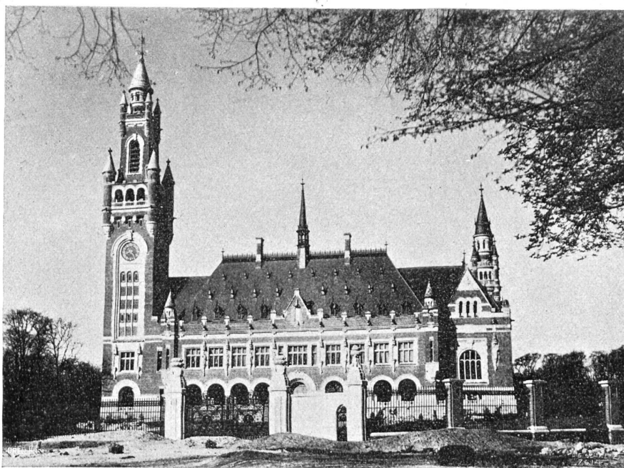
Der am 28. August eingeweihte Friedenspalast im Haag.

ren Kreisen als Kandidat der sozialdemokratischen Partei aufgestellt; zwar kam er in vier von ihnen in die Stichwahl, doch wurde er in keinem gewählt. Erst 1883 kehrte er bei einer notwendig gewordenen Nachwahl als Vertreter von Hamburg I in den Reichstag zurück. Den Wahlfreis Hamburg I hat er von 1883 bis 1898 und dann wieder seit 1899 bis jetzt im Reichstag vertreten; in der Zwischenzeit hatte er das Mandat für Straßburg-Stadt inne. Aus Leipzig wurde er auf Grund des Sozialistengesetzes 1884 ausgewiesen, worauf er sich in Plauen i. V. niederließ. 1886 wurde er wegen Geheimbündelei zu mehreren Monaten Gefängnis verurteilt; auch späterhin war er noch mehrfach in politische Prozesse verwickelt. Insgesamt hat er 56 Monate Festungshaft und Gefängnis verbüßt. Als 1890 das Sozialistengesetz aufgehoben wurde, siedelte er nach Berlin über, wo er seinen ständigen Wohnsitz nahm.