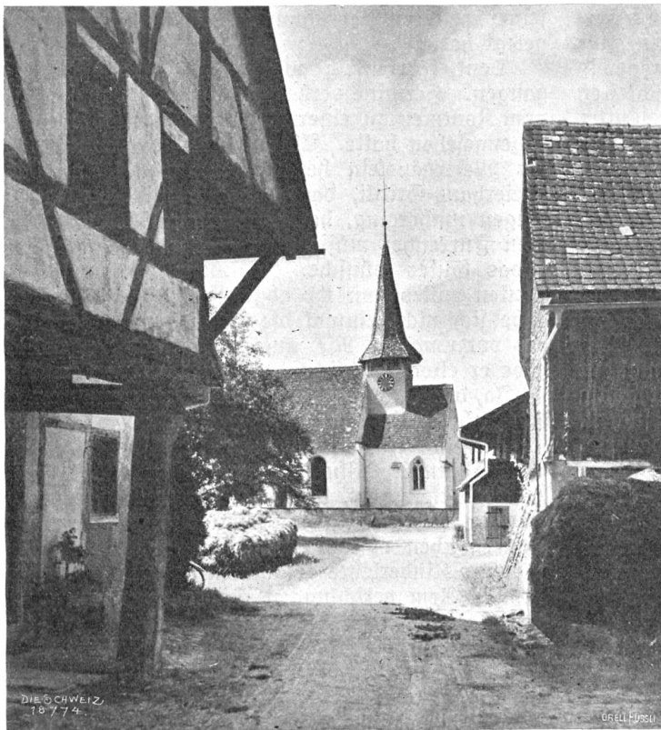
Aus Felben im Thurgau.