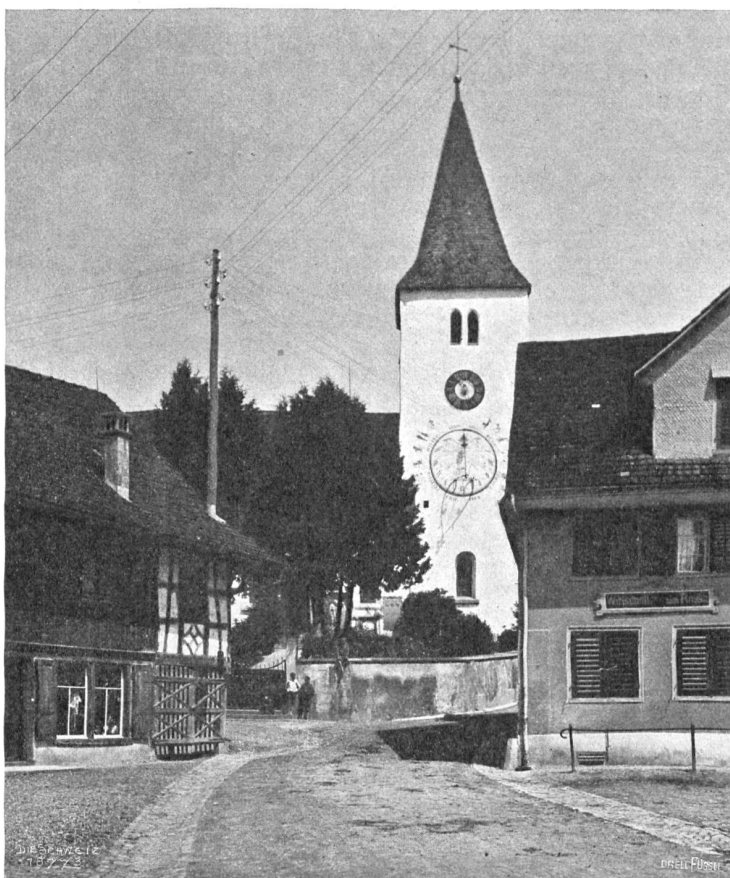
Märitetten im Thurgau. Dorfplatz mit Kirche.