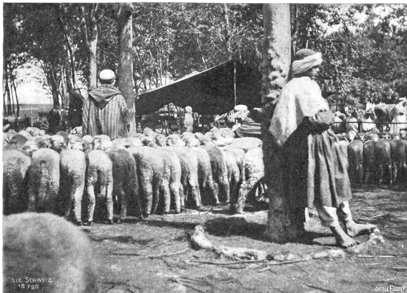
Zürich in Afrika. Viehmarkt.

In Sehenswürdigkeiten aus nachrömischer Zeit in Zürich und Umgebung hat der seit acht Jahrzehnten aufgeschüttete Kulturdünger Frankreichs soviel gezeitigt wie die moslemische Faulheit während elf Jahrhunderten: nichts. Zürich wurde aus einem großen arabischen Duar zu einem der schablonenhaften französischen Kolonialdörfer gemacht. Seine Gründung als solches fällt in das Jahr 1848. Acht Jahre zuvor warfen die gallischen Eroberer die Mauern des römischen Caesarea, die Säulen des griechischen Vol um, gaben dem alten Phöniziernebst den verpfuschten Namen Cherchel. Caesarea, Vol, Cherchel ist also ein und dasselbe: der Hafen Zürichs, wenn er auch drei Wegstunden von ihm entfernt liegt. Eines Tages landete ein mit französischen Auswanderern vollgepackter Dampfer, die sich zwei Städte zur gleichen Zeit erbauen wollten: Zürich und Novi. Da sie sich natürlich lieber in ein fertiges Nest setzten, so kommt es, daß auch heute noch