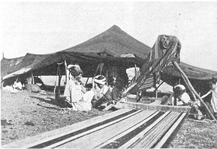
Zürich in Afrika. Am Webstuhl.