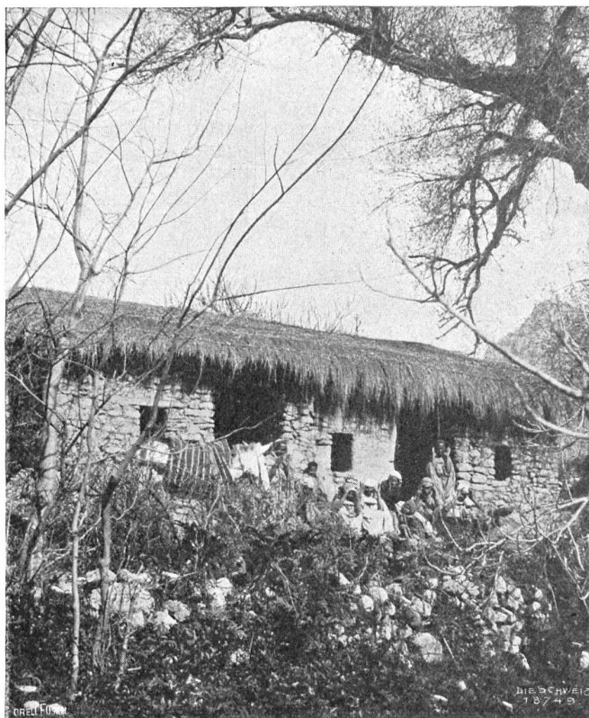
Zürich in Afrika. Im Duar.

die Eingeborenen sich dort in der Mehrzahl befinden. Daneben gibt es Spanier und Italiener, alles in allem übersteigt die Einwohnerschaft Zürichs nicht einige Hundert. Den Vorrang behauptet selbstverständlich die europäische, die katholische Religion; die Eingeborenen müssen zur Ausübung ihres Kultus