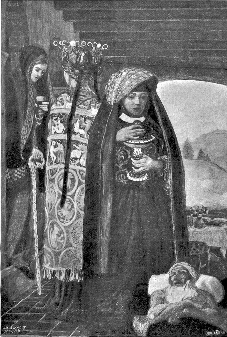
Albert Welti (1862—1912).

Teilstück aus dem „Auszug der Penaten“ (1905/06, in Werner Privatbesitz).