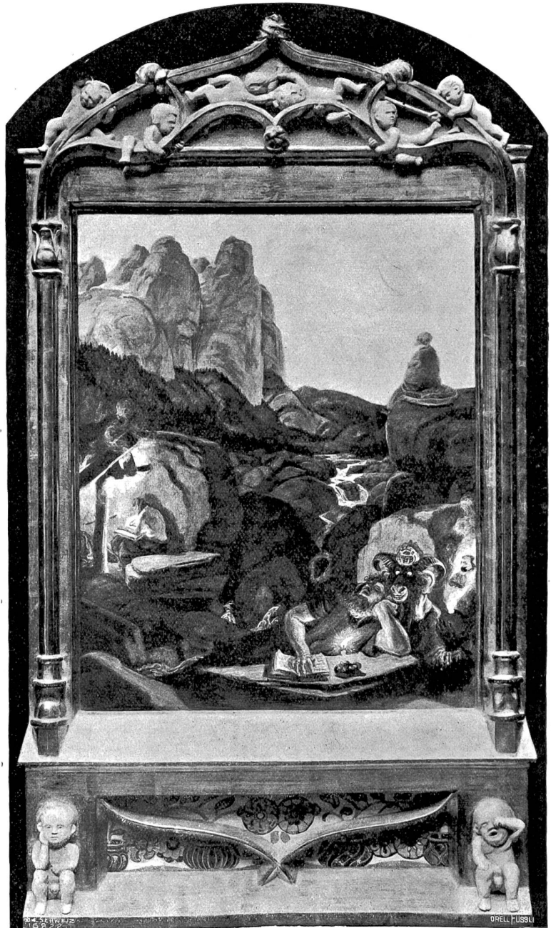
Albert Welti (1862—1912).

Die drei Eremiten. Bildtafel mit Rahmen (1907/08), im Besitz der öffentlichen Kunstsammlung in Basel.