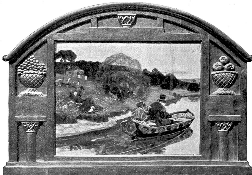
Albert Welti (1862—1912).