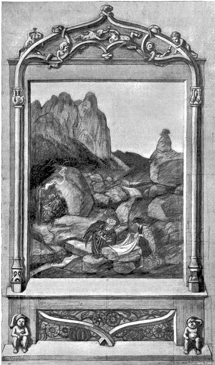
Albert Welti (1862–1912).