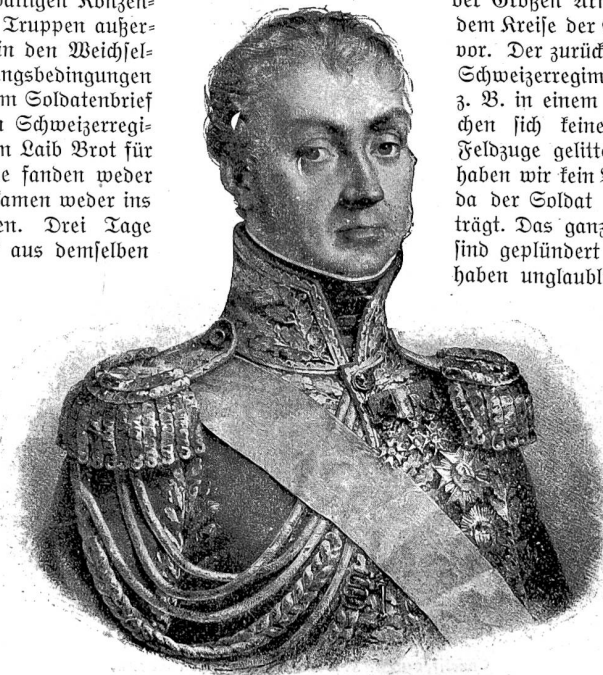
Marschall Oudinot, Herzog von Reggio. Stich der Bibliothek Luzern.