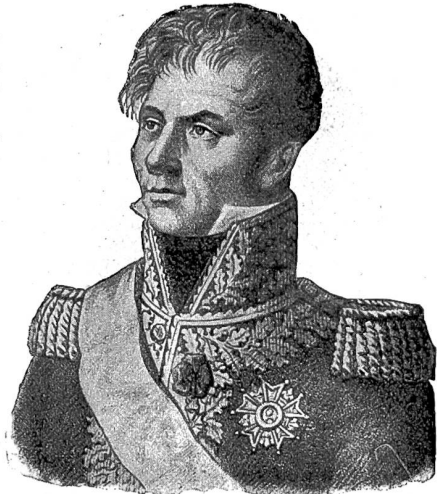
Marschall Souvion-Saint-Eyr.