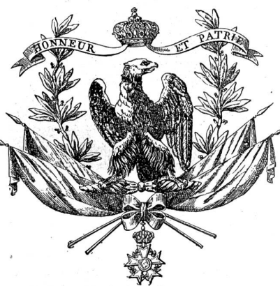
Briefkopf des 2. Schweizerregiments, I. Kaiserreich. Aus dem Bundesarchiv in Bern.