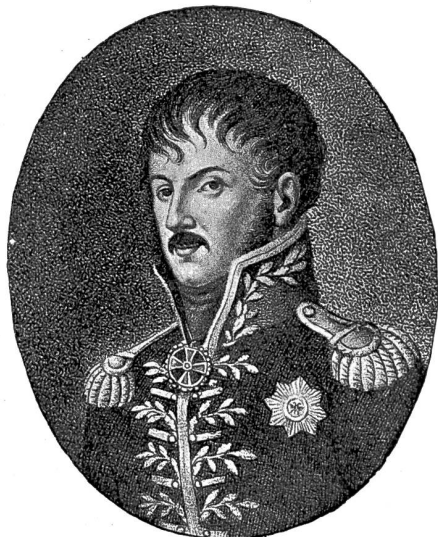
Graf Wittgenstein, Kommandant des 1. russischen Armeekorps.

„Hatte Napoleon früher,“ so urteilt ein moderner Historiker, „nicht die Kraft besessen, rechtzeitig Halt zu machen, so fehlte sie ihm jetzt, um sich in ein furchtbares Schicksal zu finden. Schließlich nötigten ihn Hunger, Verwilderung, Guerillakrieg und Kutusoffs Waffen zum Aufbruch. Freiwillig oder nicht, er mußte es räumen, das große gäh-nende Grab. Am 18. Oktober gab er Befehl zum Abmarsch. Noch war er zahlenmäßig dem Gegner gewachsen, aber das Heer glich mehr einer Nomadenhorde als einem geordneten Truppenkörper. Menschen, Pferde und Wagen waren mit Beute bepackt, Schimpfen und Fluchen erscholl. In einer Flankenbewegung suchte Napoleon an dem vorgedrungenen Kutusoff vorüberzukommen, wurde jedoch zu einem schweren Kampfe gezwungen, der ihn bestimmte, die Kalugastraße zu verlassen und auf einem Nebenwege nach Smolensk abzubiegen. Er