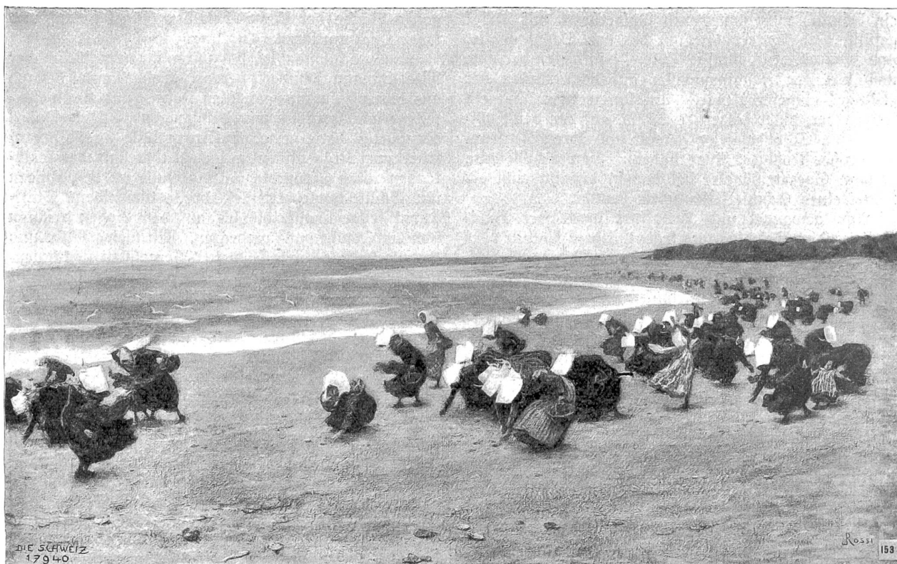
Luigi Rolli, Lugano-Mailand.