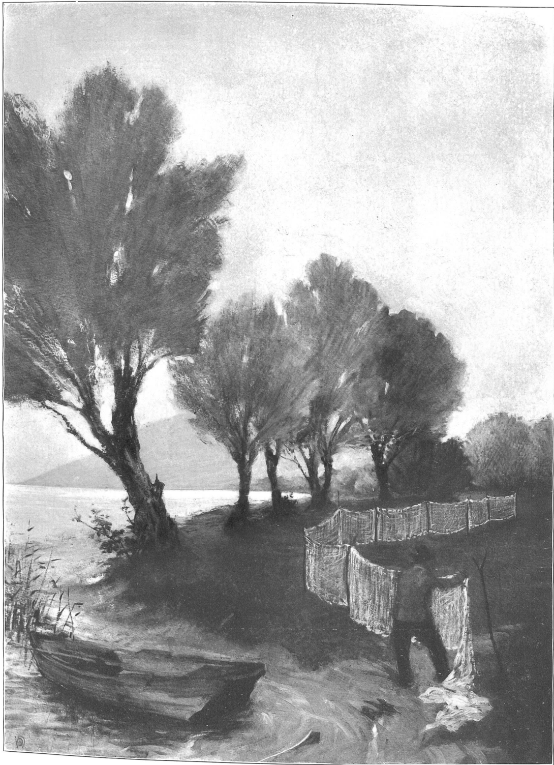
Otto Weniger (1873—1902).

Landschaftsstudie. (Bei Altenrhein am Bodensee, 1898).