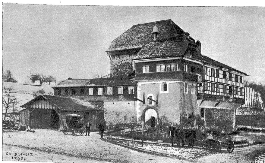
Schloß Hagenwil, Kt. Thurgau.

Ich bin berufen allenthalbn/ Kan machen viel heilsame Salben/