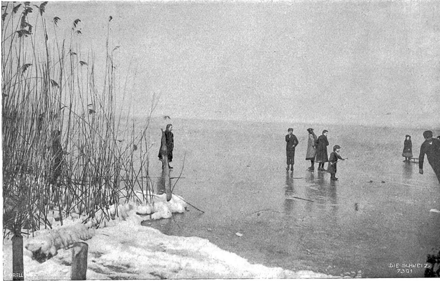
Auf dem Untersee im Winter.

See reichlich erbeutet werden, die Winterfreuden nicht unwesentlich vermehrt.