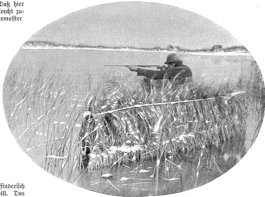
Wilderer auf der Entenjagd am Bodenlee.

Mitte Dezember, ein trüber, feuchter, düsterer Vorwinter- tag. Das schöne Schweizerland in einen einzigen grauen Schleier gehüllt: Nebel bedecken das ganze Mittelland und ent-