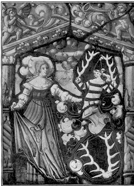
Abb. 4. Wappenstein vom Homburg (ca. 1515), von Anthony Glaser, Basel († 1551).