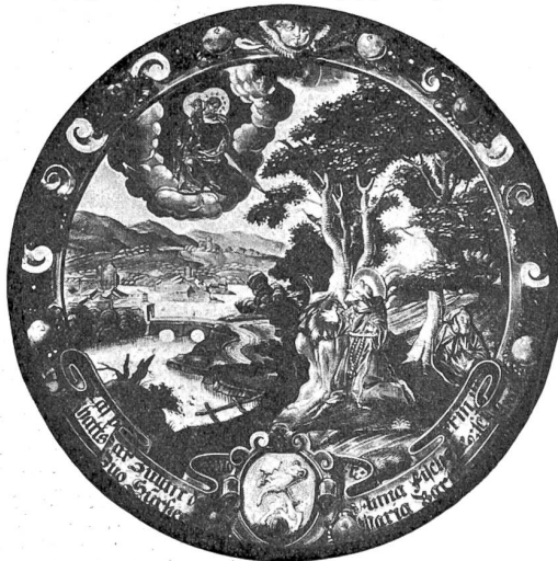
Abb. 2. Rundes Monolithscheibchen (ca. 1690), von Franz Joseph Müller, Zug (1658—1713).