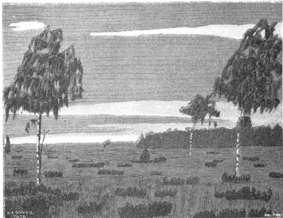
Zur Kultur des Auges Abb. 3. Weideland. Freiwillige, selbständige Konkurrenzarbeit (Komposition) eines Schülers der I. Seminarstufe.

Zum Schluß noch ganz kurz einige Hinweise auf die Mittel, die uns zur Pflege des zeichnerischen Ausdrucks dienen können; am leichtesten verstanden werde ich wohl, wenn ich von meinem eigenen Unterricht am Seminar ausgehe. Jeder meiner Zöglinge führt ein kleines Skizzenbuch. Er zeichnet hinein, was ihn reizt: Vorschriften mache ich gar keine. Und da kann ich denn — wie vorhin angedeutet — nicht selten konstatieren, daß oft Schüler, die sonst im Zeichnen während der Schulstunden, wo es sich natürlich mehr um ein strenges