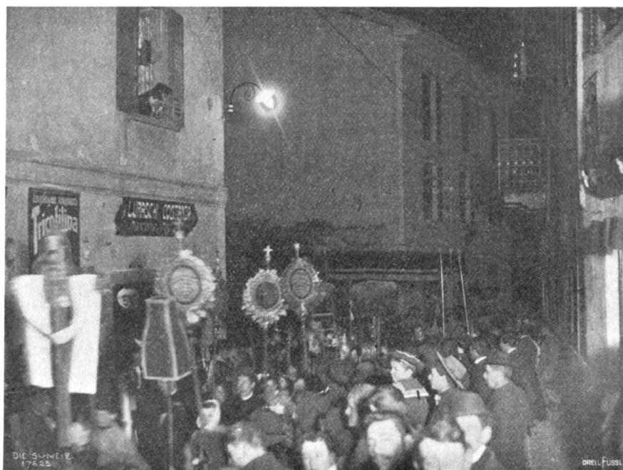
Passionsprozession in Mendrisio in der Charfreitagsnacht (Blitzlichtaufnahme).

immer häufiger und länger. Sie und da nahm eine besorgte Mutter ihrem Engelsen — es war auch ein bebrilltes dabei — die Leiter aus der Hand und wog die Last mit bedenklicher Miene. Oder ein runzlicher Alter verwies entrüstet einem Neßbuben irgend einen allzuweltlichen Knabenstreich.