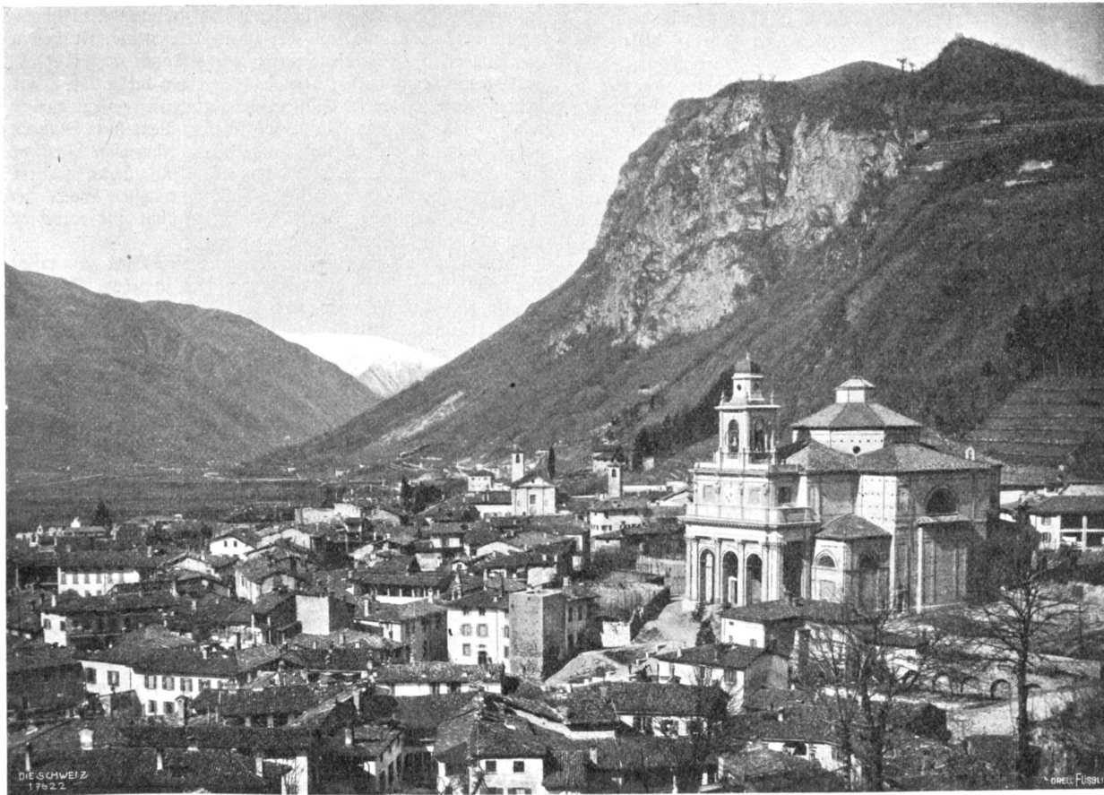
Gesamtanicht von Mendrisio.

Doch nun zu Ihrem Briefe! Es hat Ihnen wohlgethan, schreiben Sie mir, daß ich die geschlossenen, musikalisch architektonischen Formen auch in der dramatischen Musik festzuhalten suche, so lange es angeht, und Sie finden darin den wichtigsten Gegensatz zwischen mir und Wagner, welcher dieselben als unverträglich mit dem dramatischen Fortgange erklärt, und in seinen neuesten Werken seit Tristan auch faktisch aufgibt. Das ist mir ganz aus der Seele gesprochen, lassen Sie mich kurz andeuten, wie ich dazu kam. Zunächst war es wohl inneres Bedürfnis, ich konnte nicht anders; daneben hatte ich aber auch gewisse Anhaltspunkte, daß die Versöhnung des musikalischen und dramatischen Prinzips, und zwar beide in ihrer vollen Reinheit