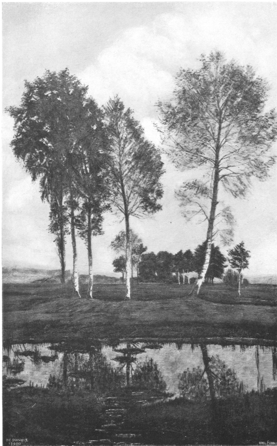
Karl Rauber (1866—1909).