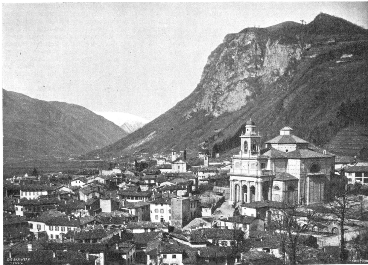
Gesamtanicht von Mendrisio.

Doch nun zu Ihrem Briefe! Es hat Ihnen wohlgethan, schreiben Sie mir, daß ich die geschlossenen, musikalisch architektonischen Formen auch in der dramatischen Musik festzuhalten suche, so lange es angeht, und Sie finden darin den wichtigsten Gegensatz zwischen mir und Wagner, welcher dieselben als unverträglich mit dem dramatischen Fortgange erklärt, und in seinen neuesten Werken seit Tristan auch faktisch aufgibt. Das ist mir ganz aus der Seele gesprochen, lassen Sie mich kurz andeuten, wie ich dazu kam. Zunächst war es wohl inneres Bedürfnis, ich konnte nicht anders; daneben hatte ich aber auch gewisse Anhaltspunkte, daß die Versöhnung des musikalischen und dramatischen Prinzips, und zwar beide in ihrer vollen Reinheit