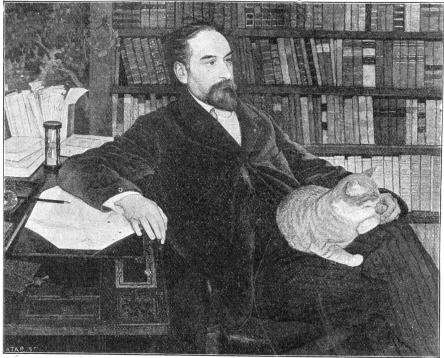
Edouard Rod (1857–1910). Nach dem Bildnis von Ernest Biéler, Saviese.

Paris spielenden Romane stärker idealistisch gehalten sind und der Wirklichkeit ferner stehen. Nahte der Herbst, so zog es Rod wieder nach der Großstadt und ihrem intensiven geistigen Leben. Sein Salon in der Rue Erlanger, dann in Passy war stark besucht, und hier fand sich ein gemischtes Publikum zusammen, wie es bei der gegenwärtigen schroffen Spaltung in Konservativ-Klerikale und Republikanisch-Freisinnige in Paris selten vorkommt. Rod zog es zu beiden hin, und doch blieb er beiden im Grunde fremd; von jenen schied ihn sein Agnostizismus, von diesen seine politisch immer konservativere Gesinnung. Auch viele Schweizer fand man hier: Isabelle Kaiser, Jeanne de Meistrals-Combremont, C. F. Ramuz, G. de Reynold, E. de Voccard und viele andere, die sich heimlich fühlten und denen er in überaus herzlicher Weise stets dienstfertig entgegenkam. Rod als Freund war ein Thema, das in den Nekrologen der Schweizerpresse in den letzten Wochen in vielen Tonarten variiert wurde, obschon alle in Dank und Lob einig waren. Soviel hilfsbereite Güte, soviel Verständnis und Interesse für die jungen Anfänger wird man gerade bei Pariser Größen selten finden. Die Güte war einer der hervorstechendsten Züge in Rods Charakter. Und neben ihr der Ernst, jener schwermütige, grübelnde Ernst, der seine Bücher meist so traurig macht, der aber ihnen gerade bleibenden Wert verleiht. La vie privée de Michel Teissier und La seconde Vie, La Sacrificée, Les Roches blanches, Ma-