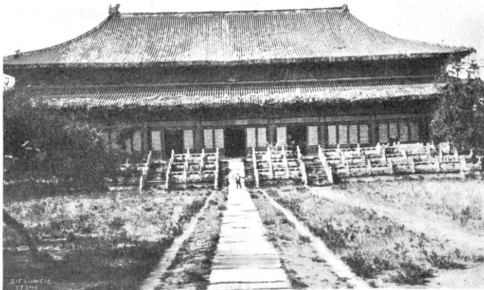
Aus China, Abb. 1. Große Opferhalle des Kaisers Jung Lo in den Ming-Gräbern.

Der Ratsherr umfaßte den vollgesenkten Becher und stellte ihn zur Seite.