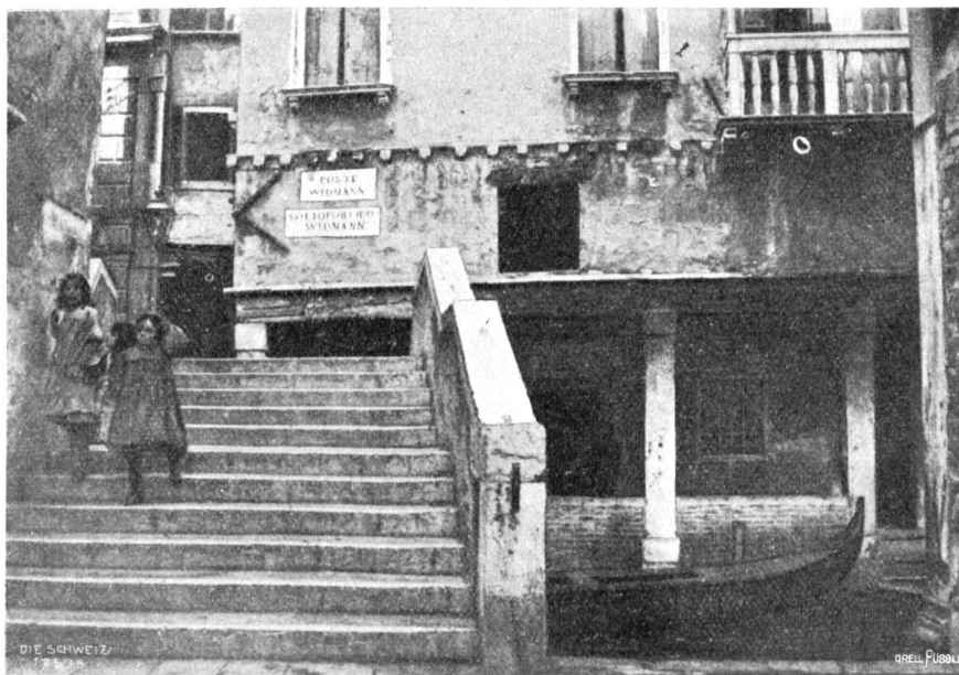
Die Widmannbrücke am Ende der Widmannallee in Venedig.