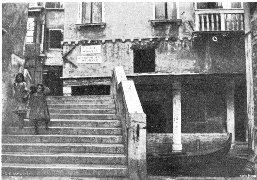
Die Widmannbrücke am Ende der Widmannstraße in Venedig.

Mit zwei Abbildungen nach photographischen Aufnahmen der Verfasserin.