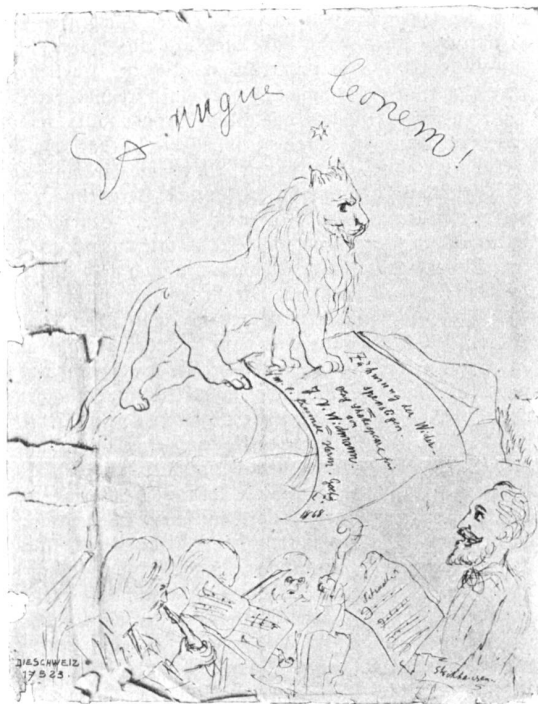
Blatt aus dem handschriftlichen Textbuch mit Zeichnung von F. W. Widmann (Widmung an Hermann Goetz).

Werke zum Glück ausschlagen, und auch Ihnen zur Freude gereichen wird.