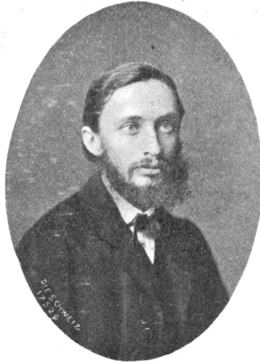
Hermann Goetz (1840-1876).