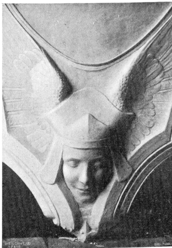
Aus dem Bundesgerichtsgebäude, Abb. 2 und 3. „Arbeit“ und „Gerechtigkeit“, Details vom Gegenstück zum Bronzerelief Abb. 1.