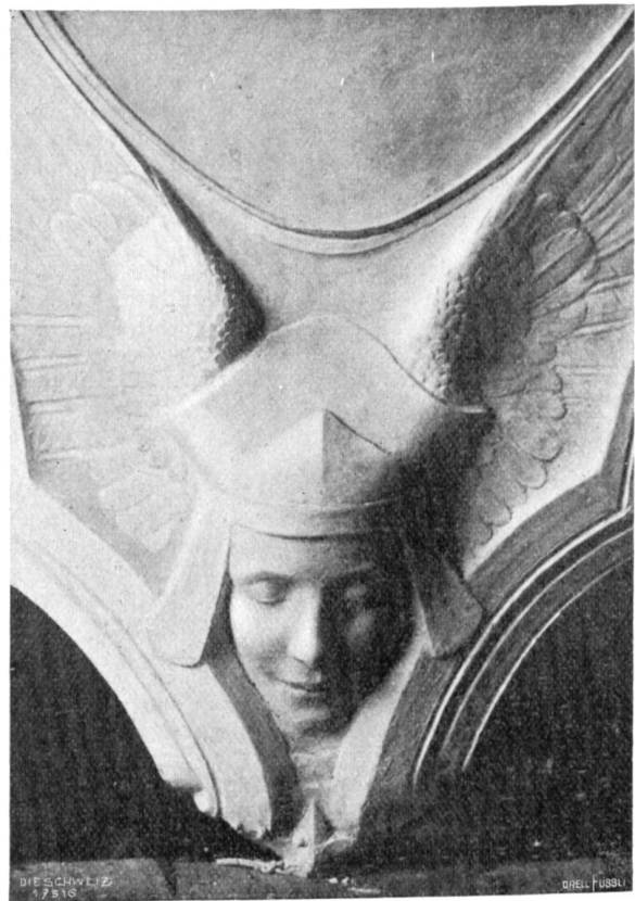
Aus dem Bundesgerichtsgebäude, Abb. 2 und 3. „Arbeit“ und „Gerechtigkeit“, Details vom Gegenstück zum Bronzerelief Abb. 1.