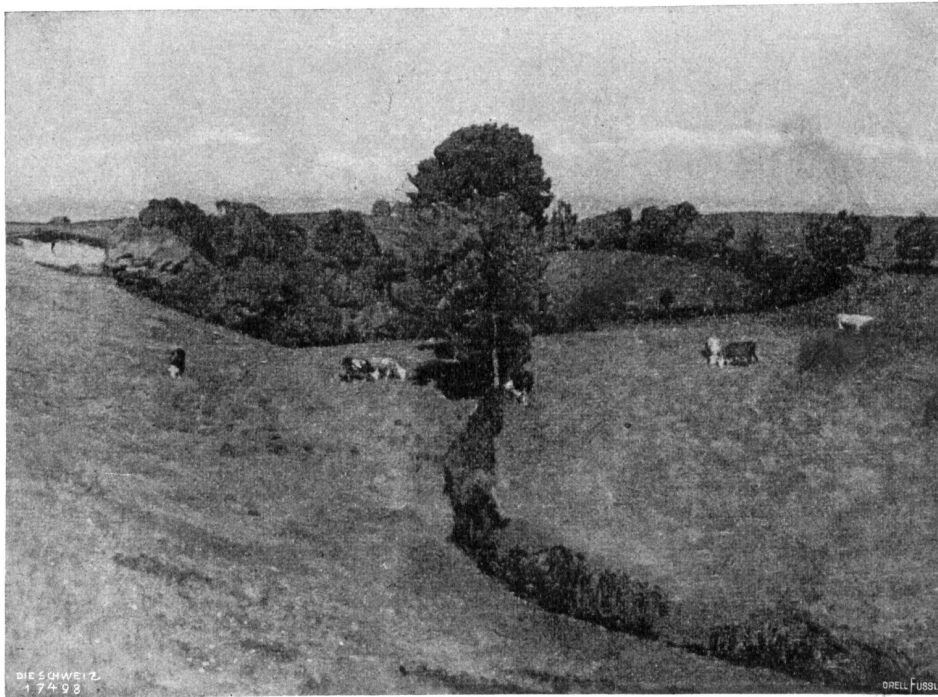
Plinio Colombi, Bern.