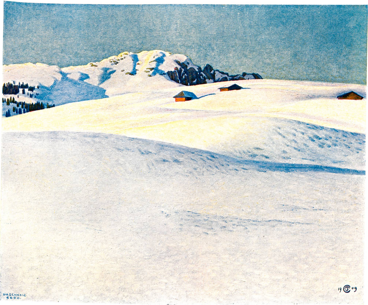
Plinio Colombi, Bern.