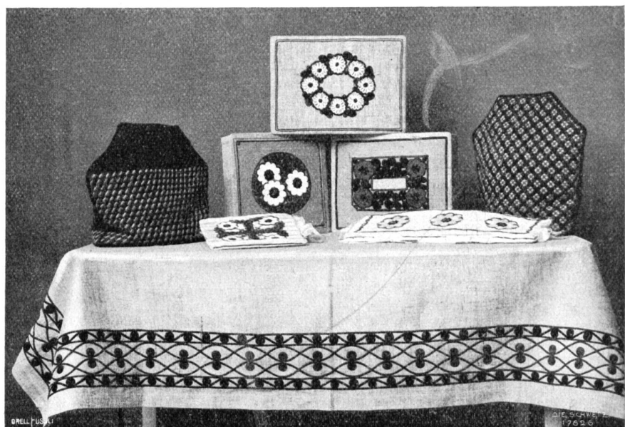
Walther Koch, Davos. Decke, Taschentuchfästchen, Kaffeewärmer etc.