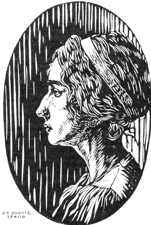
DIE SCHWEIZ 17808