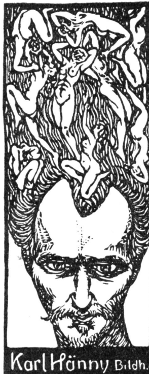
DIE SCHWEIZ 17809

Der „Siegfried Schweizer“ ist nicht im Dialekt geschrieben, wie es beim „August Wehrli“ der Fall; dies ist deshalb nicht zu bedauern, weil dadurch dem Stück die Möglichkeit gegeben ist, sich einen Platz auf der Berufsbühne zu erobern, wie er ihm wohl gebührt, und für das Liebhabertheater bleibt es auch so geeignet, weil es ganz im Schweizerischen und in der realen, einem jeden ver-