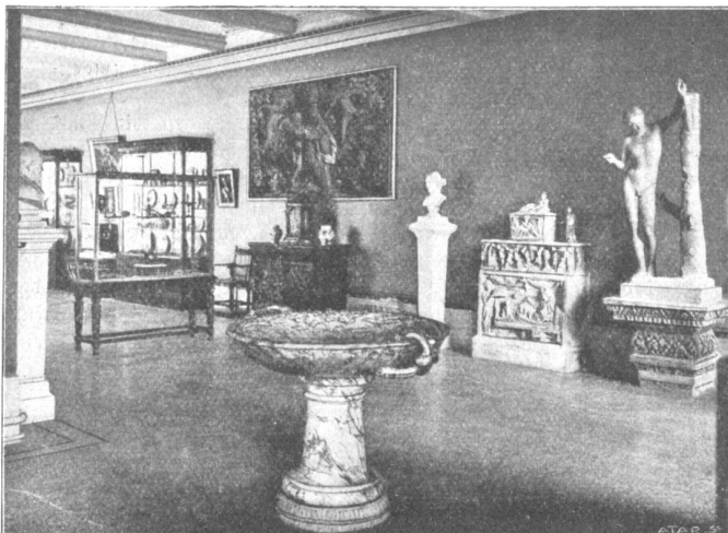
Galerie Fol im neuen Museum für Kunst und Geschichte in Genf.