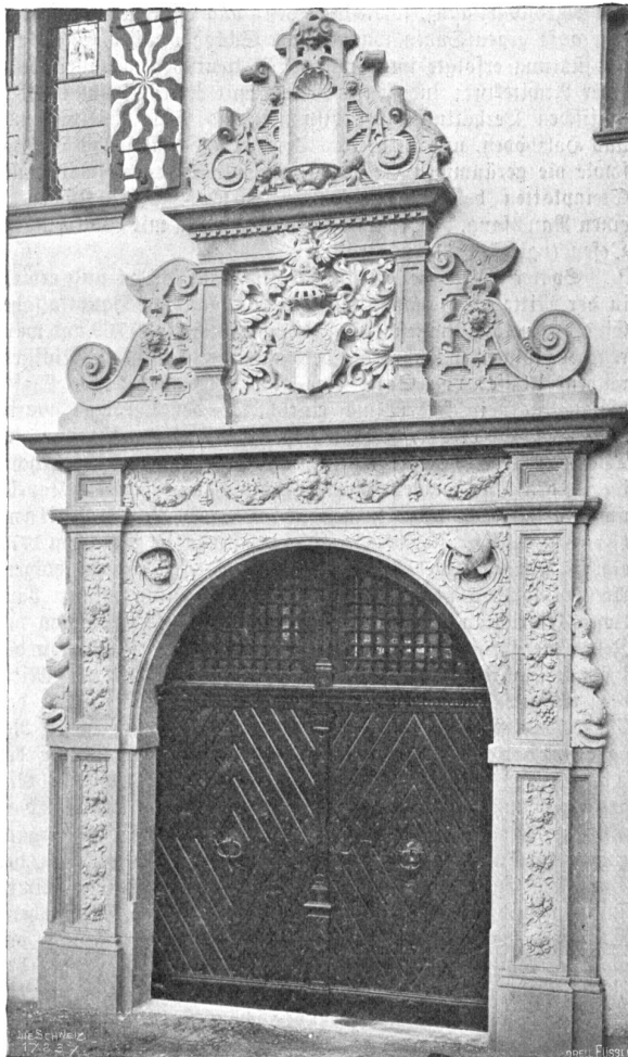
Schloß Marchlins. Hauptportal.

„Ich kann nicht, Herr Doktor, es ist zu grausam!“ „Lassen Sie doch diese Hyperästhesie einmal, Herr Pfarrer! Eine Wanderung in die Berge scheint mir mehr und mehr