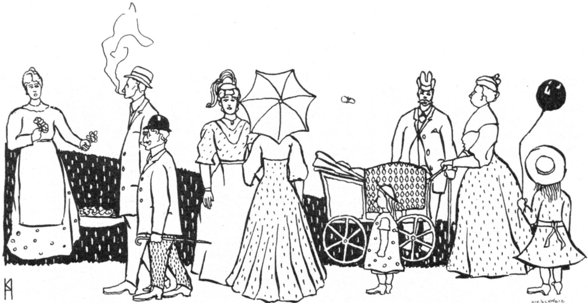
„Philister, die ihre Familie lüften.“