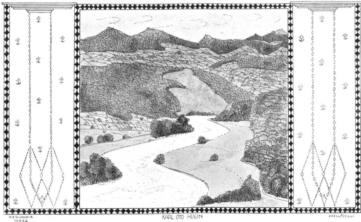
Sommer im Sihlthal.