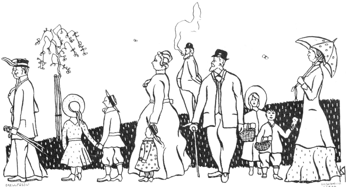
Karl Otto Hügin, Zürich.

wende sie sich an eine unsichtbare Macht, mit der sie in geheimen Kämpfen stehe, da sie nun weiter spricht: „So will ich denn zeigen, daß ich stark bin auch für ein Strahlchen Sonne, auch für ein Fleckchen ungewohnter Wärme und für eines Menschen kluges Angesicht!“