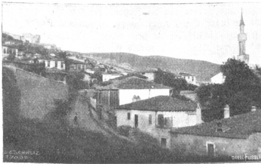
Ex oriente lux. Abb. 16. Stadtteil von Saloniki mit Zitabelle; Platz, wo nach der Legende der Apostel Paulus predigte.

tigste Stadt der Türkei war, so datiert ihre Kultur doch erst von ihrer Befreiung in den sechziger und siebziger Jahren des letzten Jahrhunderts und ist in ihren Fortschritten nur um so mehr zu bewundern oder wenigstens zu achten. Angesichts der unbestreitbaren Kulturfortschritte dieser durch äußere und innere Feinde — zu denen auch die auf die Volksverdummung abzielende orthodoxe geistlose Geistlichkeit gehört — bedrängten und bedrückten Völker wäre etwas mehr wohlwollendes Verständnis bei den beati possidentes im Abendlande angezeigt.