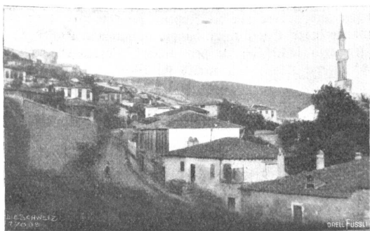
Ex oriente lux. Abb. 16. Stadtteil von Saloniki mit Zitadelle; Platz, wo nach der Legende der Apostel Paulus predigte.

tigste Stadt der Türkei war, so datiert ihre Kultur doch erst von ihrer Befreiung in den sechziger und siebziger Jahren des letzten Jahrhunderts und ist in ihren Fortschritten nur um so mehr zu bewundern oder wenigstens zu achten. Angesichts der unbestreitbaren Kulturfortschritte dieser durch äußere und innere Feinde — zu denen auch die auf die Volksverdummung abzielende orthodoxe geistlose Geistlichkeit gehört — bedrängten und bedrückten Völker wäre etwas mehr wohlwollendes Verständnis bei den beati possidentes im Abendlande angezeigt.