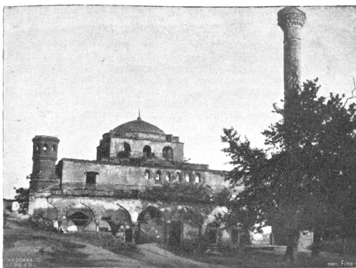
Ex oriente lux. Abb. 17. Hagia Sofia, Hauptmoschee von Saloniki.