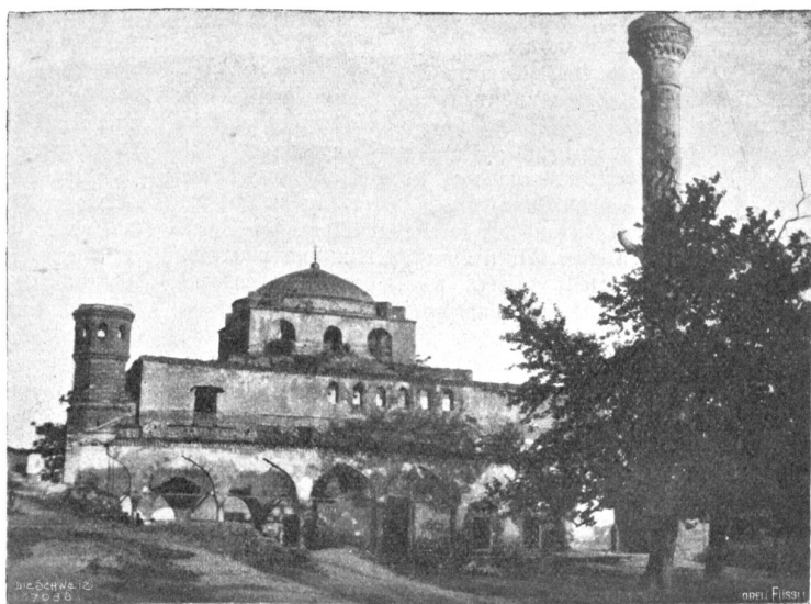
Ex oriente lux. Abb. 17. Hagia Sophia, Hauptmoschee von Saloniki.

zubringen suchten. Darum reiste Baumgarten, nachdem ihn Tell aus Vogts Gewalt befreit hatte, mit der Sammelbüchse herum. Ich hielt mich aber so nahe und so weit vom Spielplan,