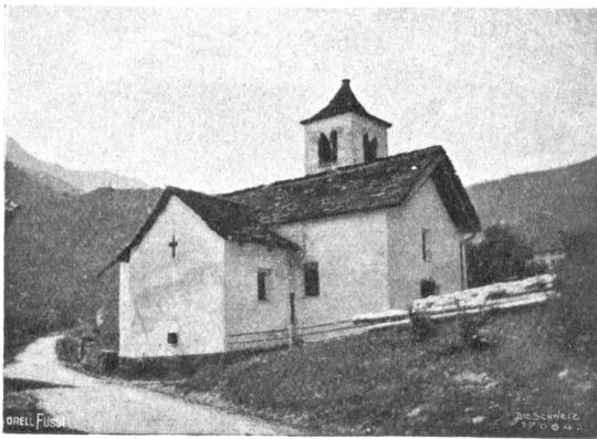
Columbanskirche von Scona, von E. A. gesehen.

Wir beschloßen, in Hausen, wo keine vermöglichen Leute wohnten, das Spiel zu kürzen. Nachdem Geßler den Apfel auf des Kindes Haupt als Ziel gegeben, sollte ich gleich um Erlassung des Schusses bitten. Es geschah so. Aber unser Geßler, der sein Sprüchlein wohl vor- und rückwärts konnte, fiel kläglich aus der Rolle. Grimmig stierte er mich an und sagte: „Du Chalb!“ Das war ein trauriges Fiasko. Gut, daß der eifrige Frießhard mit der Sammelbüchse schon um war. Enttäuschte Gesichter folgten uns, als wir, nachdem mich Geßler mit jener Verlegenheitsphrase auf das Stichwort hatte aufmerksam machen wollen, den Vorhang plötzlich fallen ließen, d. h. sofort abzogen. Einige größere Burschen, welche die Apfelschußzene aus dem Schulbuch kannten, forderten mit Kluchen ihr Geld wieder zurück und drohten uns mit Stecken.