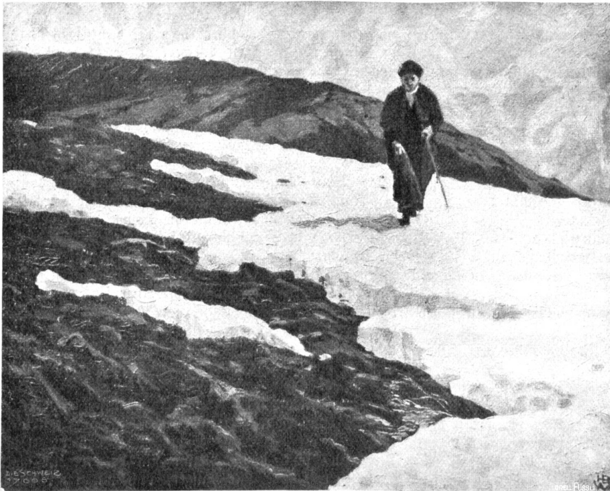
Hans Beat Wieland, Basel-München. Schneeschmelze (1905).

"Laßt es gut sein, Vena! Wir kennen einander... Ich möchte noch den Tag erleben, da Ihr so heiße Tränen der Freude weinet... Und nun," sagte er mit fast geschäftlicher Ruhe, "wann bestatten wir den Richters-hauser Müller? Ich denke doch, ihr holt ihn heim?"