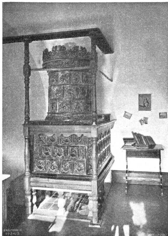
Schloß Marischlins. Prättigauer (Luzerner-) Ofen in einer Dachstube.