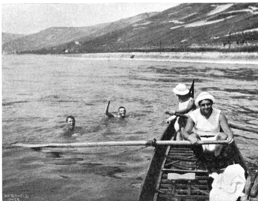
Basel-Rotterdam Abb. 4. Bad unterhalb dem Binger Loch.

Begleitet von einem Herrn vom Mainzer Ruderklub in einem Kanoe aus Aluminium verließen wir Mainz um acht