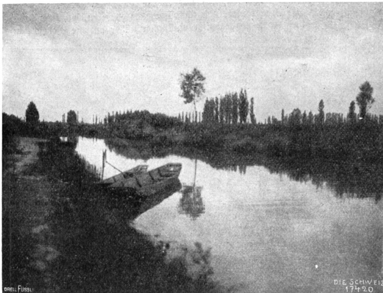
Basel-Rotterdam Abb. 2. Kanal bei Gressern.

Am Morgen, nach dem Provianteneinkauf, an dem das ganze Dorf liebevoll mithalf, stiegen wir um halb neun Uhr bei grauem Himmel von Gressern ab. Bald mußten wir des