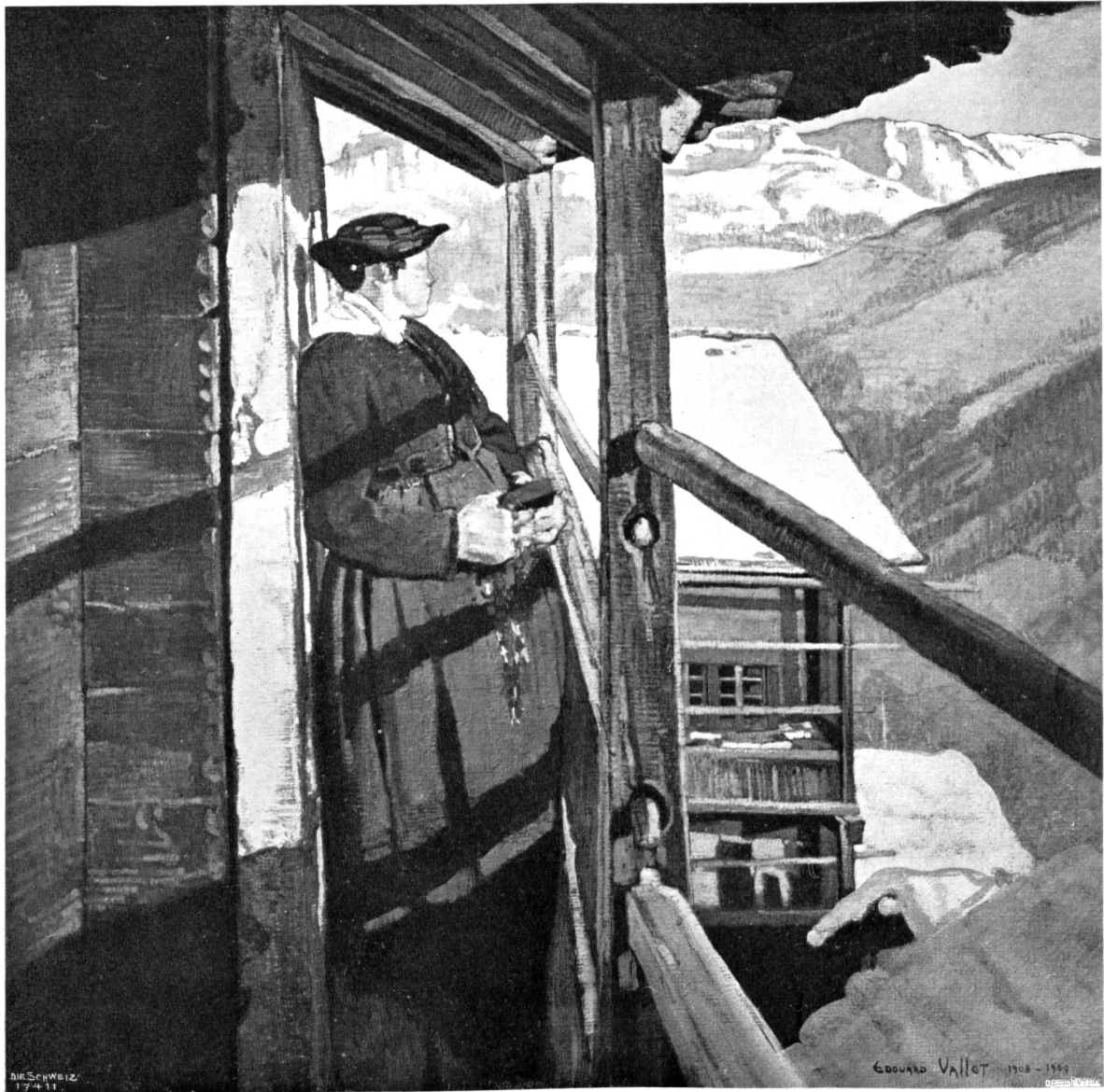
X. internat. Kunstausstellung München.