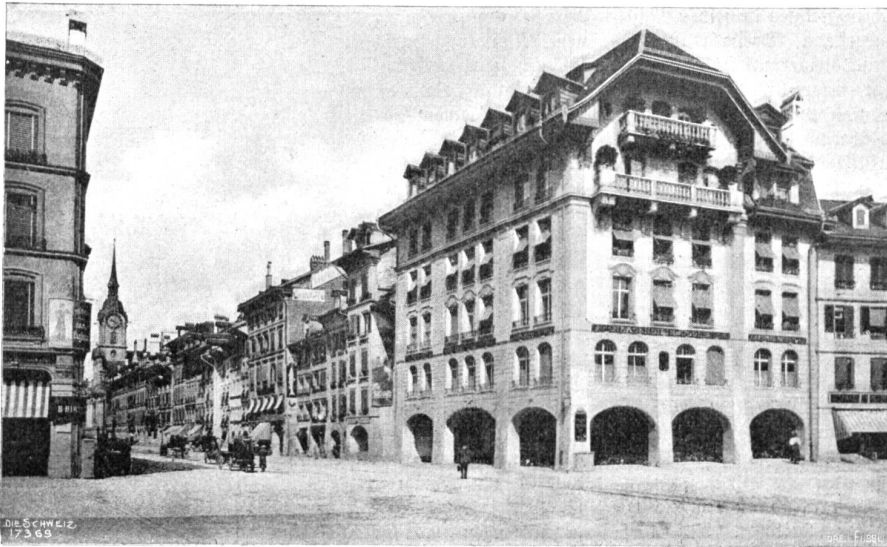
Neue Berner Baukunst. Warenhaus Zurbrugg an der Spitalgasse. Architekt: Eduard Joos, Bern.

die] Madonna von Caravaggio. — Die Bilder des heiligen Lucio sind besonders interessant, weil sie uns zeigen, wie sich die Aelspler und Sennen in den vergangenen Jahrhunderten gekleidet haben; auch der Käse, das Käsemeissel, das Salz- oder Lecktäschchen ist auf Gemälden und Statuen getreu wiedergegeben. Für den Trachtenforscher noch ein schönes, unbebautes Feld!