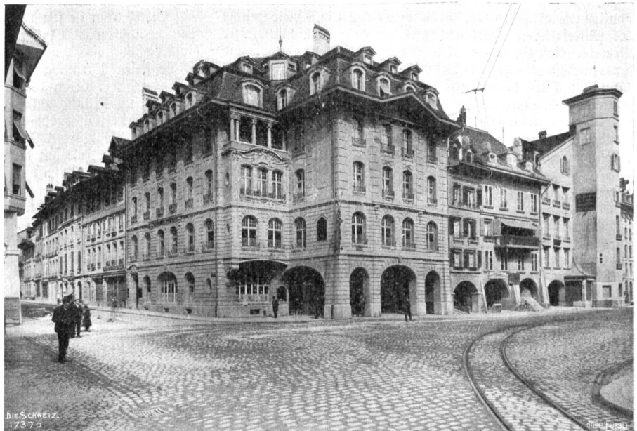
Neue Berner Baukunst. Restaurant Zytglogge. Architekt: Eduard Joos, Bern.

sich dieser Stil namentlich bei der eidgenössischen Bauverwaltung. Ob am Genfersee, in Ponte Tresa, Bern oder Chur, man baute Post-, Zoll- und andere Gebäude nur in der einzig dort akkreditierten „auf unsere Verhältnisse angewandten Bundesrenaissance“! Kein Mensch fragte sich, was diese Bauweise je auf unserm Boden zu tun gehabt — wir haben doch nicht Italiens Sonne, nicht sein Material, sie ist all unsern Traditionen gänzlich fremd! Die Wandlung kam dann endlich von den in Deutschland ausgebildeten jungen Schweizer Architekten, und wenn auch meistens ihre Werke direkt unter dem Einfluß der Stadt, wo sie studiert, oder des Meisters, bei dem sie bis dahin gelernt hatten, standen, so suchten sie doch etwas Neues, Malerisches zu bringen: sie suchten ihre Bauten unserem Lande anzupassen. Waren sie dann etwas bei uns angefessen und hatten sie sich überzeugen können, welcher ungehobene Formenschatz in der Architektur unserer alten Schweizerstädte steckt, so wandten sie sich von selber diesem zu. An Orten, wo die Tradition besonders reiche Spuren hinterlassen, z. B. in Graub-