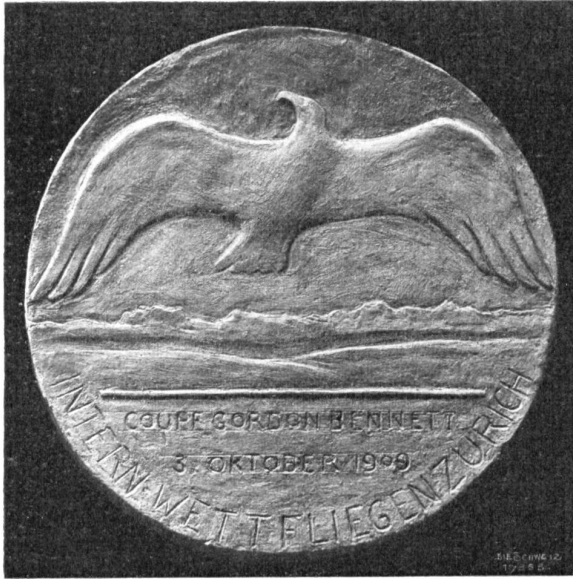
Rückseite der Medaille für das Gordon Bennett-Wettfliegen 1909 in Zürich.

Nach dem Modell von Arnold Hänerwadel, Leuzburg-Zürich.