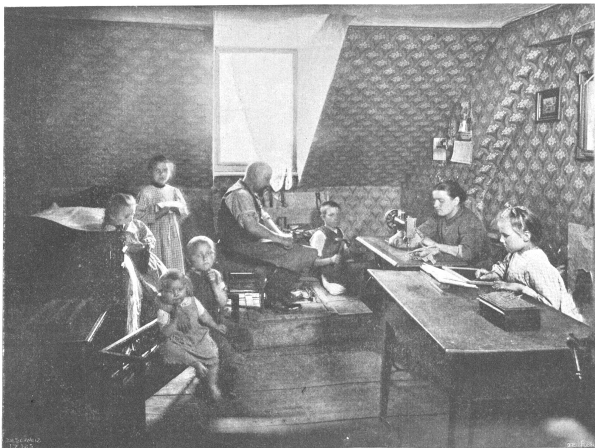
Von der I. Schweiz. Heimarbeitausstellung. Schusterfamilie in der Mansarde.

Küche am Herdfeuer und strickt an einer groben Socke für den Andres, ihren Buben auf dem Berg.