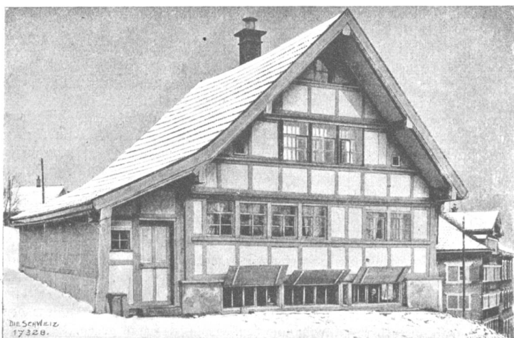
Von der I. Schweiz. Heimarbeitausstellung. Appenzellerhaus mit Webkeller.

O, sie hatte ihn noch immer gern, jetzt vielleicht mehr als damals vor zwei Jahren! Erst nachträglich, immer deutlicher in der letzten Zeit, war es ihr zum Bewußtsein gekommen, daß die dunkeln Augen des verliebten Jungen es eigentlich gewesen seien, die ihr den Mut und das Glück brachten, deren sie für ihre Künstlerlaufbahn so notwendig bedurfte. Daß sie früher nie daran gedacht hatte? Aber damals hatte ihre Kunst nur dem einen ehrgeizigen Streben dienen müssen, die Achtung und die Liebe eines Pianisten zu erfinden, der erst ihr Lehrer, dann ihr Gatte wurde.