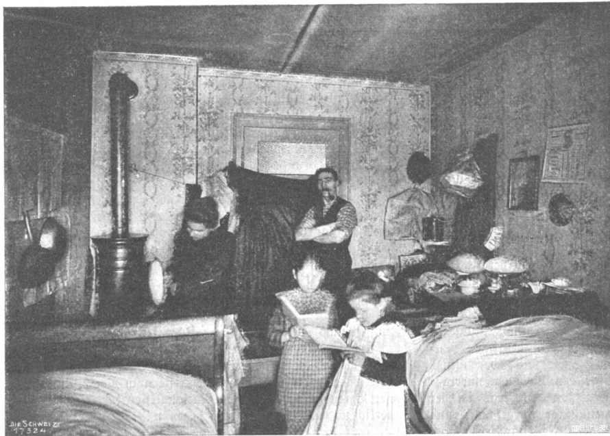
Von der I. Schweiz. Heimarbeitausstellung. Heimarbeiterwohnung in Zürich III. jetzt polizeilich aufgehoben.

Wald sieht aus, als ob ein Niese darüber hingegangen wäre und mit achtlosem Schritt da und dort eine Lichtung getreten hätte.