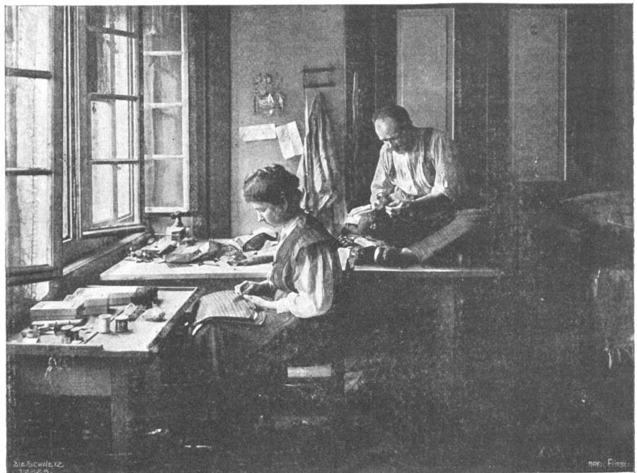
Von der I. Schweiz. Heimarbeitausstellung. Schneider mit Gehülfin in Zürich.

Die Frau wendet das kummervolle Gesicht von dem unheimlich leuchtenden Schneefeld ab, dem Wolkenmantel zu. Ihr ist, als sänte er vom Berg herunter, immer tiefer und tiefer, um auch sie einzuhüllen in seine ernsten, geheimnisvollen Falten.