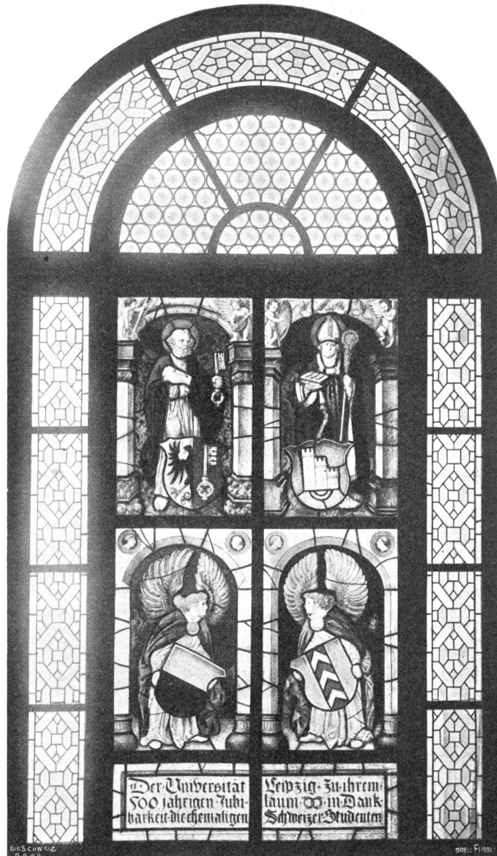
Glasgemälde für die Universität Leipzig (Genf, Freiburg, Lausanne, Neuenburg). Nach Entwürfen von Rudolf Mürger, Bern, ausgeführt von Gebr. Röttlinger, Zürich.

Ritterschaft, den feuerspeienden Drachen. Diesem Bannerträger gegenüber steht ein schmucker Fahnenjunker mit dem Banner der Stadt Bern, eine freie Nachbildung des durch seine Farbenpracht hervorragenden Glasgemäldes aus der Kirche von Lenf im bernischen Historischen Museum. Ein Gesteck von zwei Landsknechten bildet die passende Beigabe. Für Zürich und Basel wurden Wappenscheiben mit den für diese beiden Städte charakteristischen heraldischen Tieren gewählt. Der mächtige Zürcherlein trägt das Schwert, das Papst Julius II. im Jahre 1512 dem damaligen Vororte der Eidgenossenschaft schenkte und das im Original im Landesmuseum noch erhalten ist. Die Baslerischeibe ist eine getreue Kopie derjenigen in dem berühmten Fenster, das die Stadt um das Jahr 1515 in die Kirche von Segenstorf (Kanton Bern) stiftete. — Wäh-