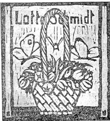
Mag Bucherer, Basel. Grilbriß R. Sch. Holzschmitt.

De Hotelier und sy Frau händs fründtli empfangen, und miteme ehrerbietige Kumpfmänt hebfi de Wirt entschuldiget: Es tüem g'wüß rächt leid, daß i' teze e so wyht ue müessid; aber er chönntene momäntan mit-em beschte