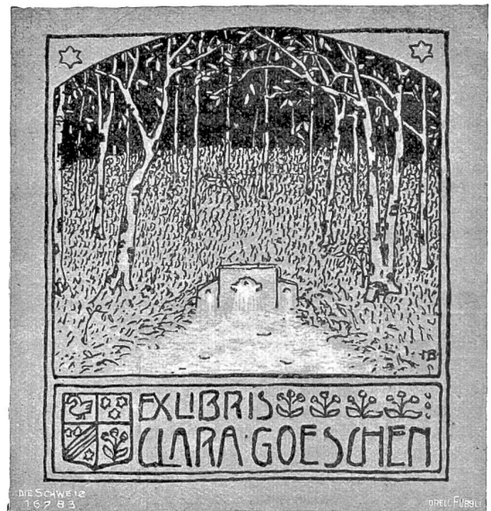
DIE SCHWEIZ 1878/3.