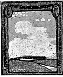
Mag Bucherer, Basel. Exlibris C. F. Holschmitt.

Hoseknöpf; me chond jo a den-e-n-Orte doch nid fettig über. Nimm au es Gütterli Wunderbalsam mit und e chli Hoffmannströpfe und d'Schlarpe, ahmer nid d' Schueh mueß alegege, wem-mer z' Nacht usse sett. 's Tubakpffysli und e paar Päckli Stümpe tue au is Göfferli ie und öppe feuf Päckli Maryland Nr. 2!"