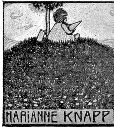
DIE SCHWEIZ 1877/5.

„Also gömmer det hi, mer müend no öppis g'nage; 's Laufe gohd iez denn a!" seid d'r G'meindrot.