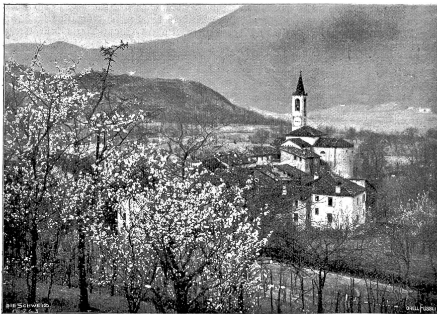
Ponte Capriasca und die Kirche mit dem Heiligen Abendmahl; im Vordergrund blühende Mandelbäume.

Petrucha und Agascha erreichten ihre Hütte und traten ein... Auf der Bank hinter dem Fenster lag Mitka in seinem verwaschen-roten, baumwollenen Hemdchen, mit einem ernsten, sorgenvollen Ausdruck auf dem eingefallenen Gesichtchen, mit halbgeöffneten Augen. Sein blondes Haar hing wirr um das blassköpfige. Der Leib war unförmlich gedunsen, unter dem kurzen Hemdchen ragten zwei dürre magere Beinchen hervor, die Händchen waren über der Brust gefaltet... Zahllose Fliegen um-